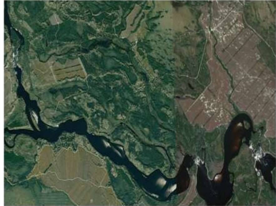
Les 9 ème , 10 ème et 11 ème Chutes de la Rivière Mistassini