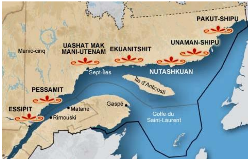
Carte indiquant l'emplacement des sept communautés membres de l'AMIK

des conseils de bande ou des communautés innues elles-mêmes. Ils ne peuvent également être considérés comme une consultation adéquate des communautés membres ni restreindre de quelque façon l'exercice de leurs droits.