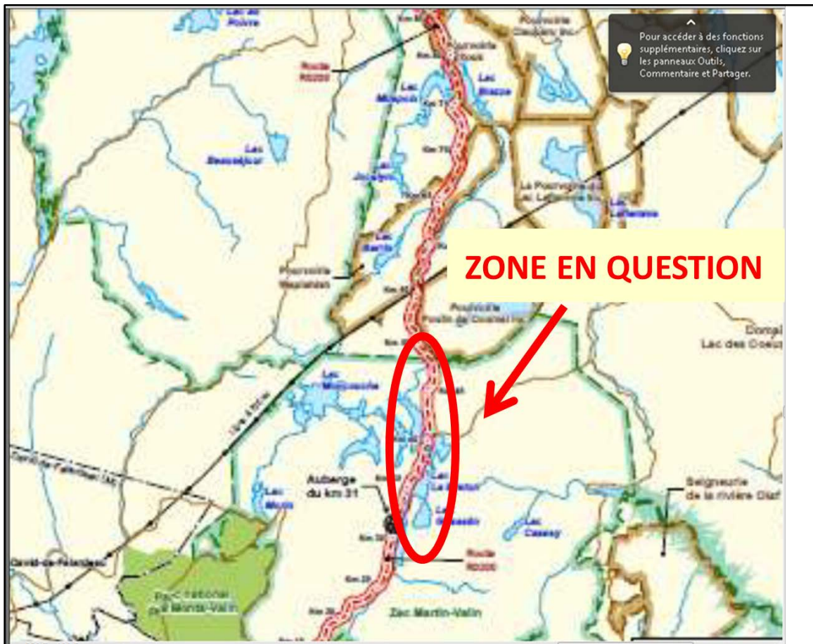
Figure 1: tirée du projet minier http://www.arianne-inc.com/fr/projet-minier/etude-dimpact