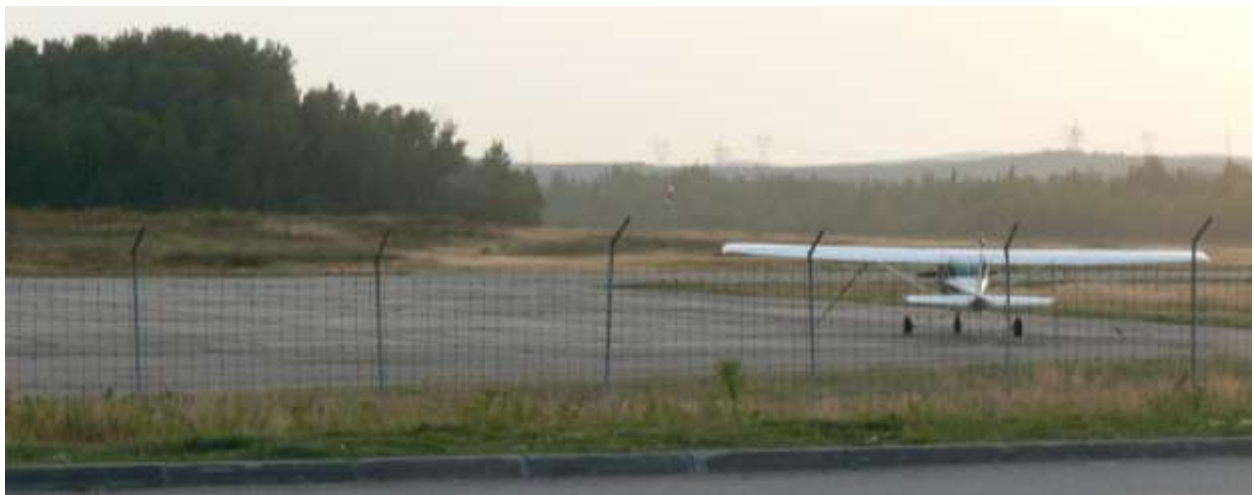
Aéroport (piste pavée de 4900 pieds Est-Ouest)