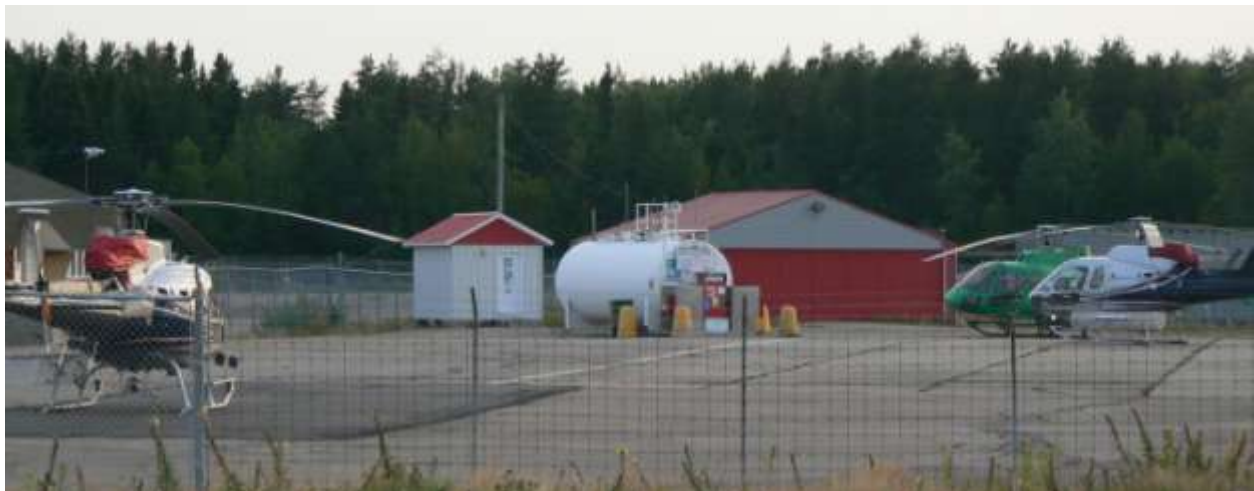
Héliport ouvert à l'année, situé au centre de la ville