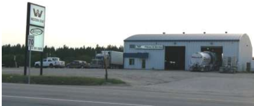
Centre du Camion Côte-Nord