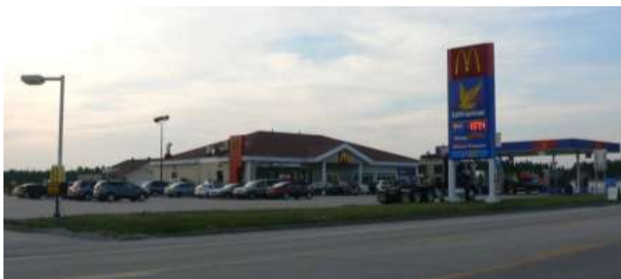
Ultramar - Mc Donald « Truck-stop »