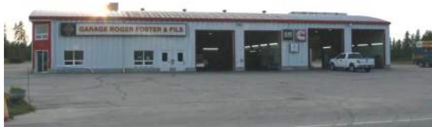
Garage Roger Foster & Fils inc.