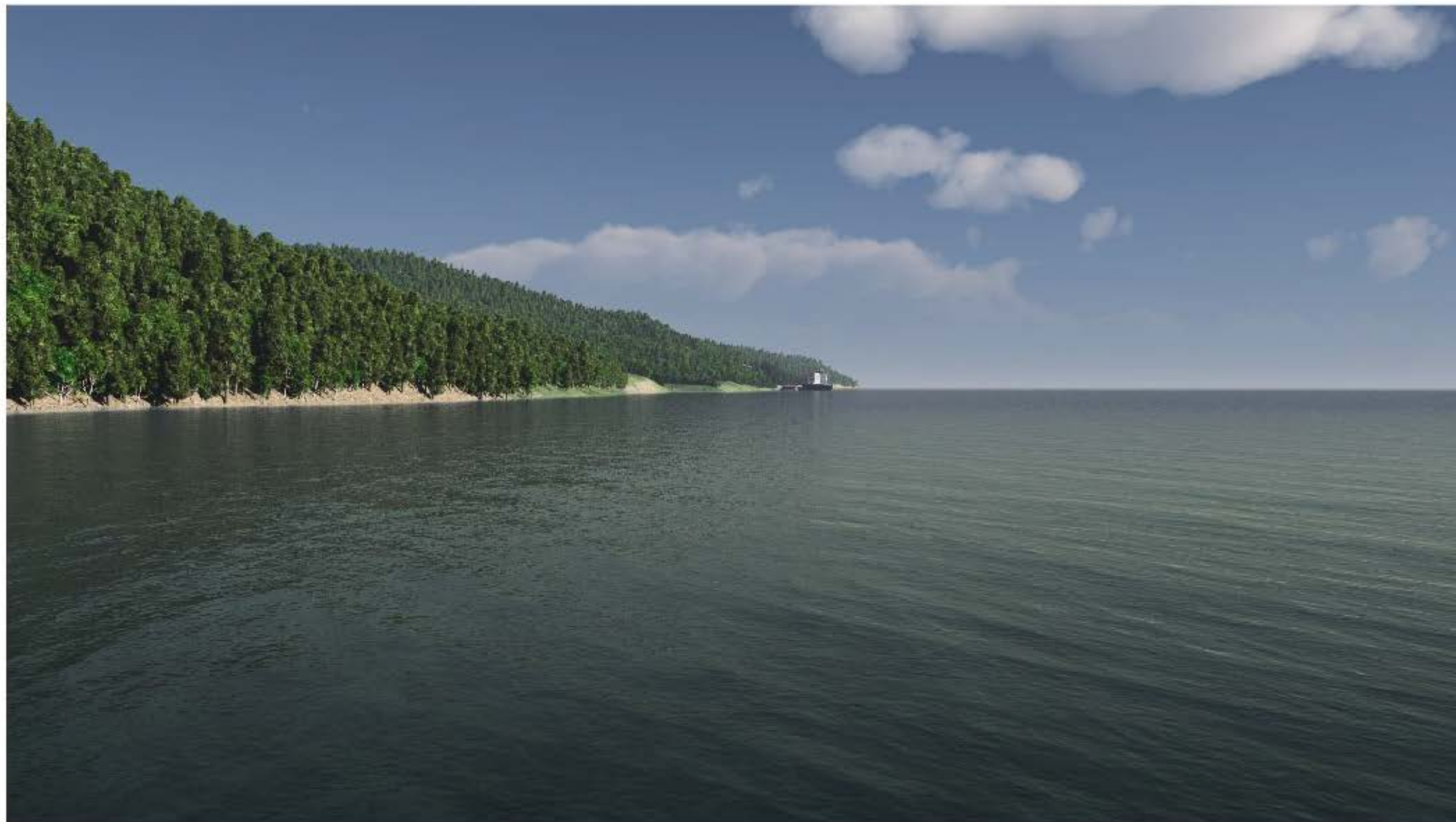
TERMINAL MARITIME PROJETÉ - SECTEUR DE L'ANSE À PELLETIER (3Km du terminal) Décembre 2014