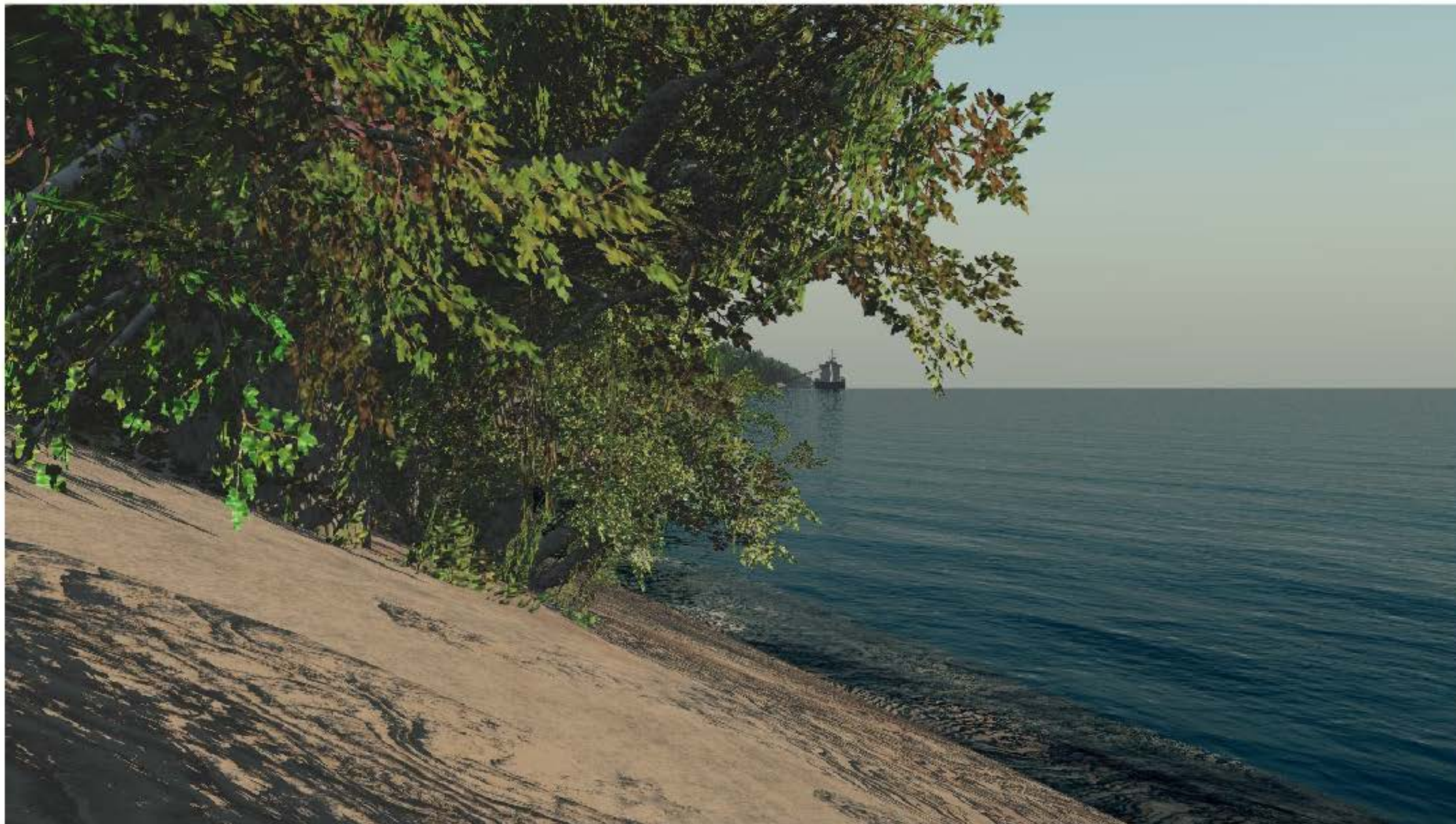
TERMINAL MARITIME PROJETÉ - Vue @ 2.1 Km du terminal Décembre 2014