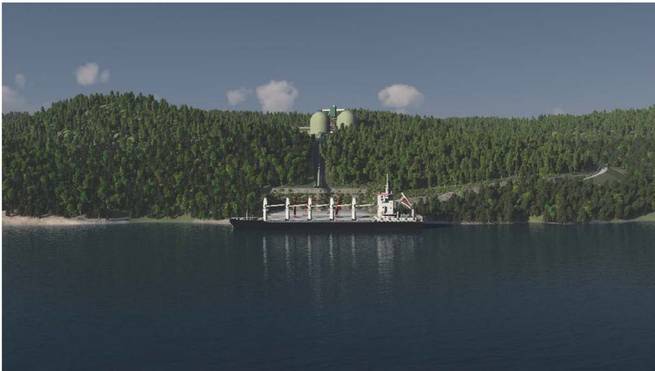
TERMINAL MARITIME PROJETÉ - Vue perpendiculaire @ 800m du terminal Janvier 2015