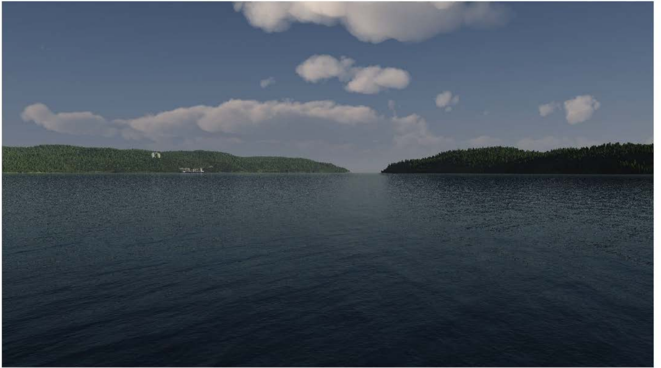
TERMINAL MARITIME PROJETÉ – SECTEUR DU CAP JASEUX (6.7 km du terminal) Janvier 2015