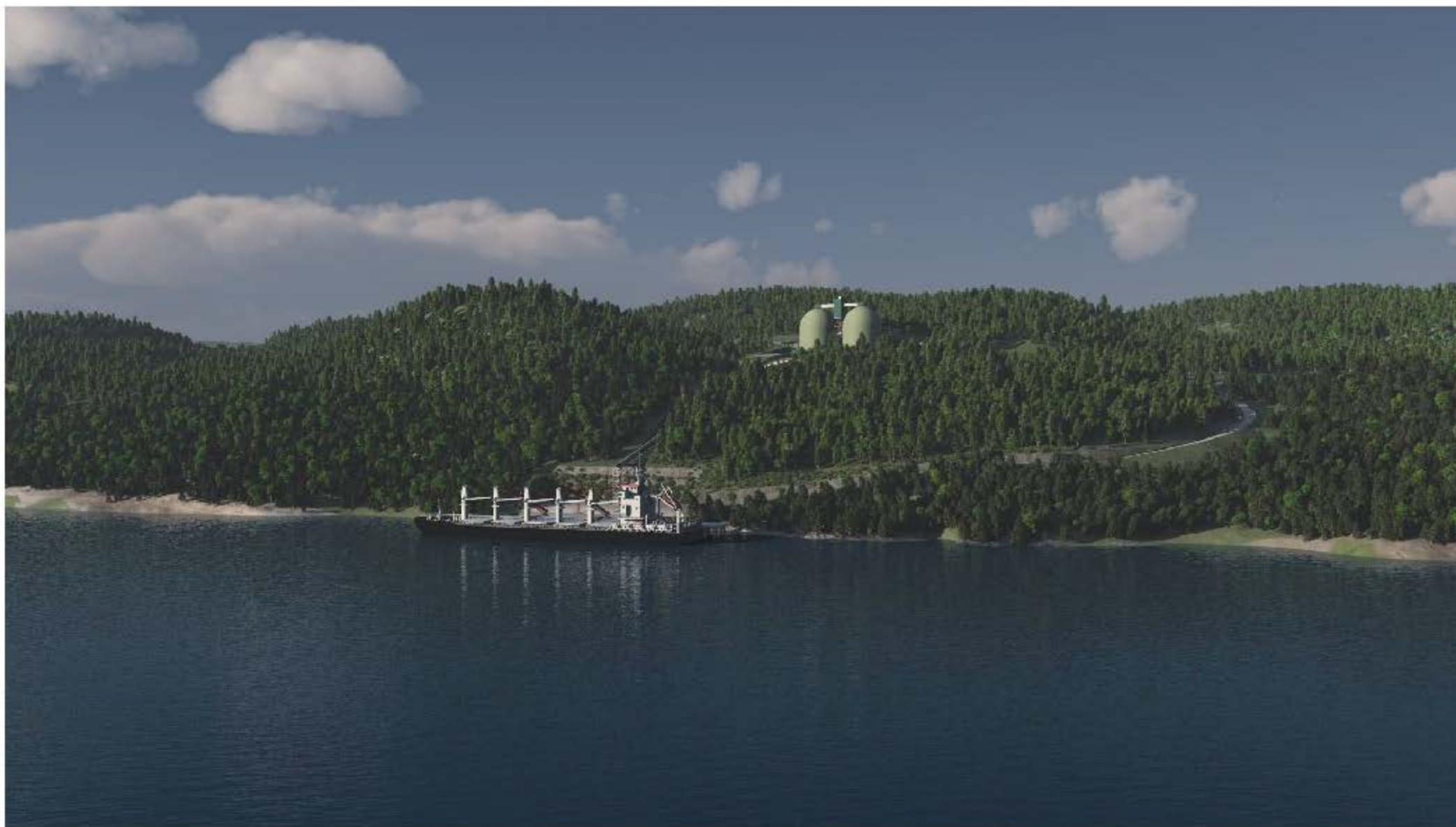
TERMINAL MARITIME PROJETÉ - PERSPECTIVE (1 km du terminal) Janvier 2015