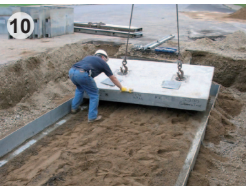
Dépôt des couvercles sur une baie de jonction