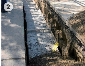
Remblayage de la tranchée