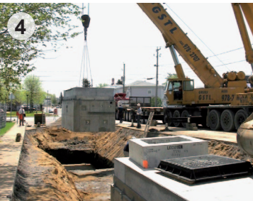
Installation de baies de jonction