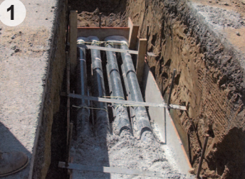
Mise en place des conduits dans la tranchée