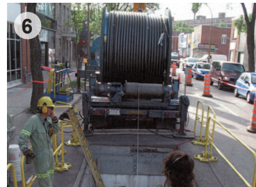
Tirage des câbles dans une baie de jonction