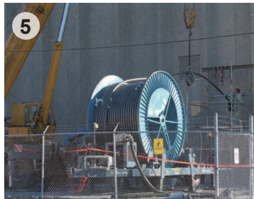
Tirage des câbles au poste