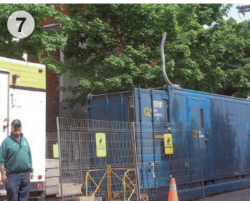
Abri de jointage