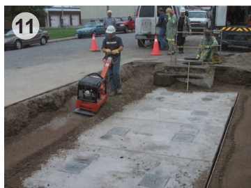
Remise en état des surfaces