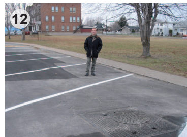
Aspect de la chaussée après les travaux