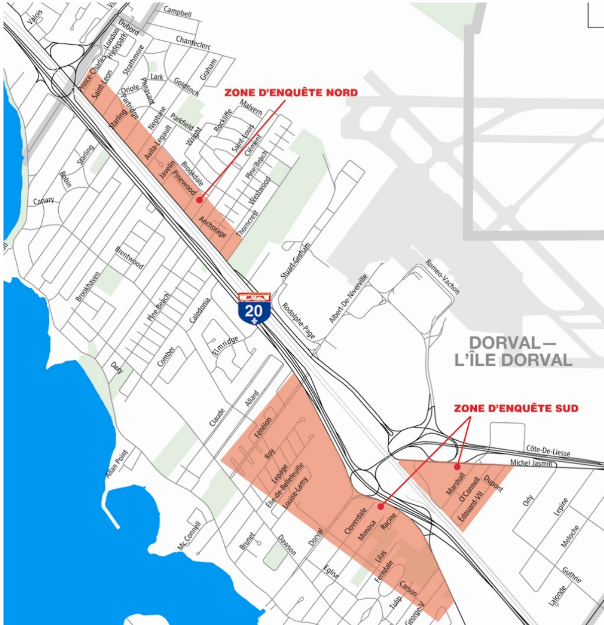
Figure 1 : Zones d'enquête du sondage auprès des résidents riverains de l'échangeur Dorval