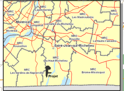
CARTE 3.2-1A RECONNAISSANCE DE L'HABITAT DU POISSON