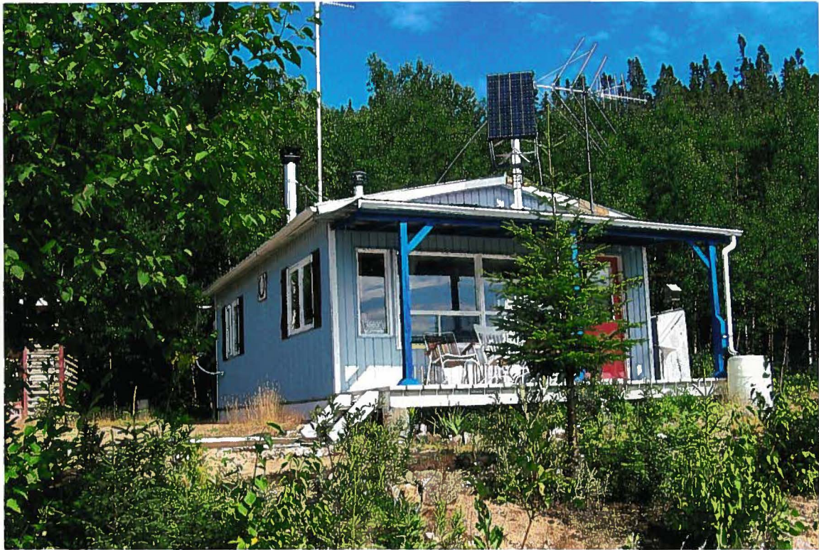
CHALET MICHELINS et MAURICE. #BAIL 201277