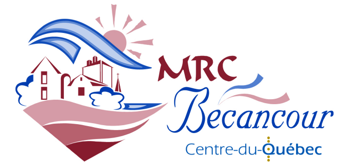
SCHÉMA D'AMÉNAGEMENT ET DE DÉVELOPPEMENT RÉVISÉ