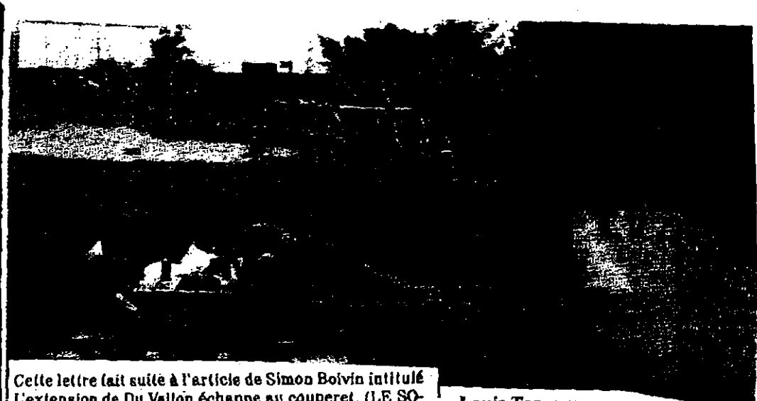
Cette lettre fait suite à l'article de Simon Boivin intitulé L'extension de Du Vallon échappe au couperet, (LE SOLEIL, 10 janvier 2004)

Les deux assemblages d'essences arborées ne sont pas touchés par le projet.