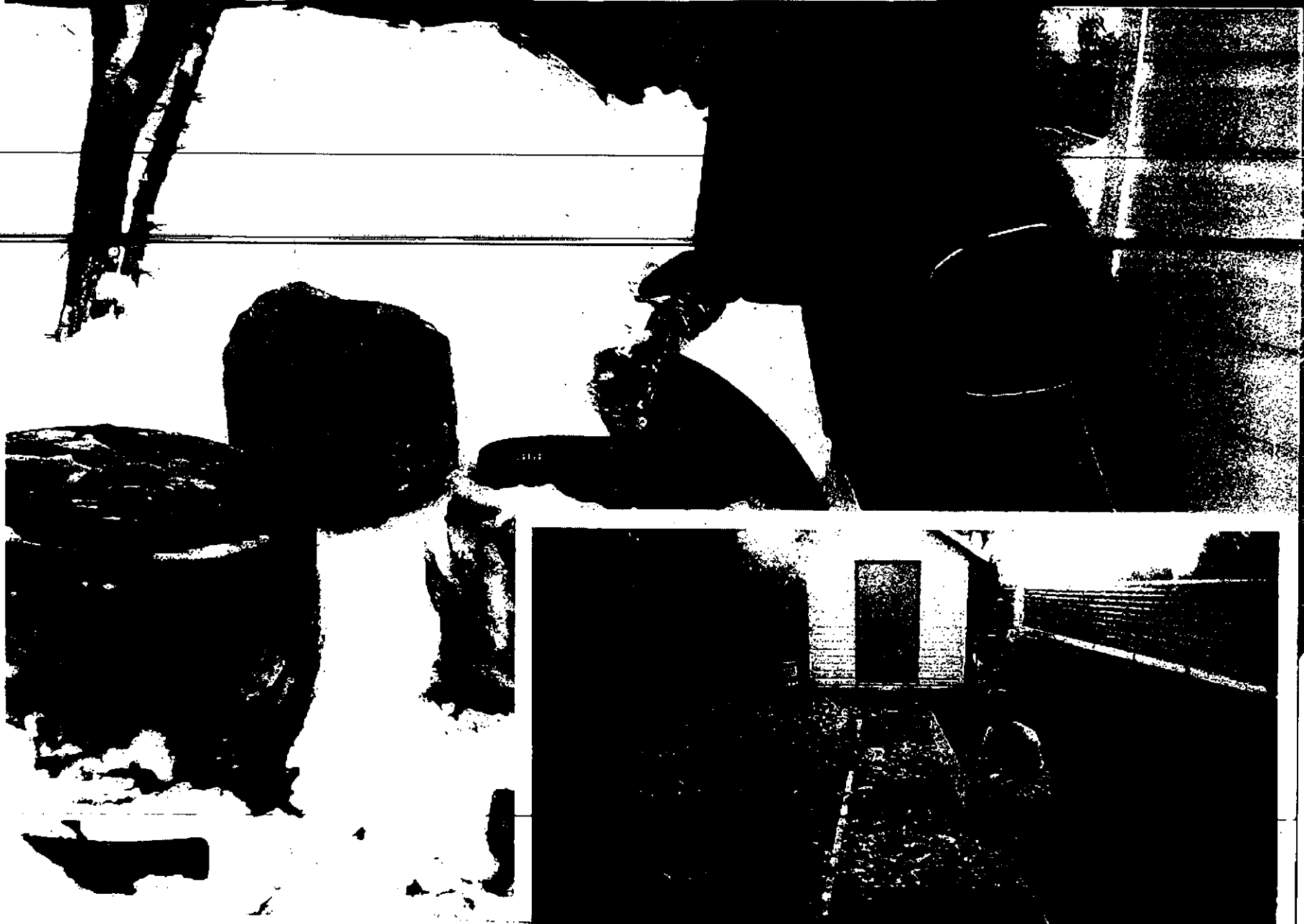
NOUS RÉCUPÉRONS LES FEUILLES ET LES RÉSIDUS DE CUISINE