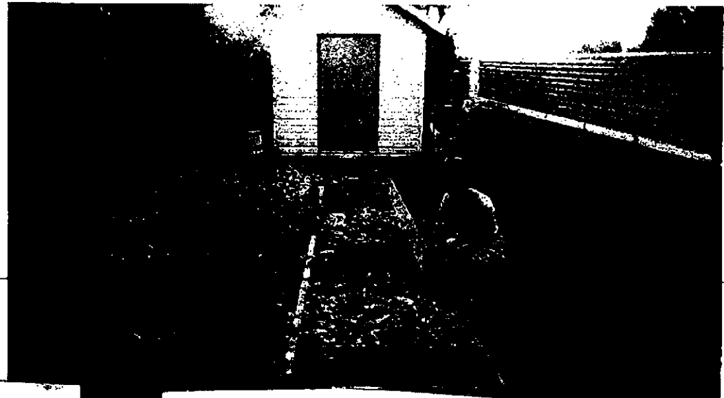
NOUS FAISONS NOTRE PROPRE COMPOST