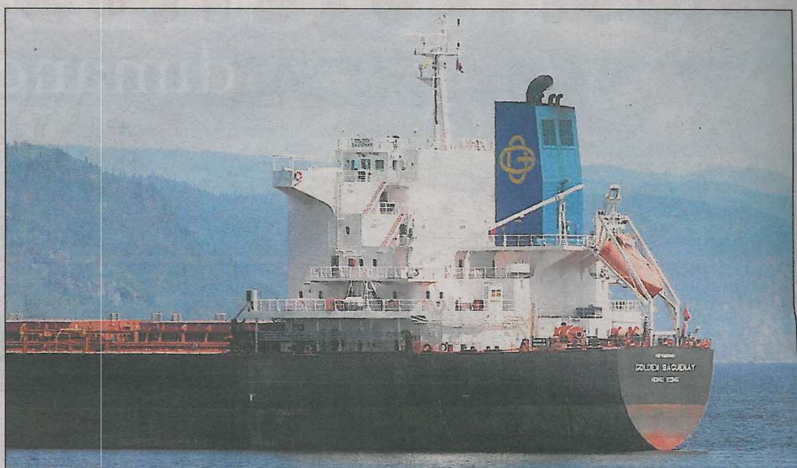
À l'heure actuelle, il est parfois difficile d'accueillir deux navires en même temps au port de Grande-Anse.

« L'appui de la ville est primordial si nous voulons nous développer », dit-il. □