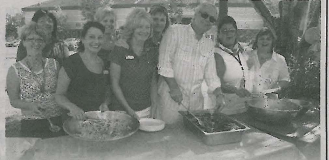
Des membres du personnel du centre l'Oasis lors de la pause repas