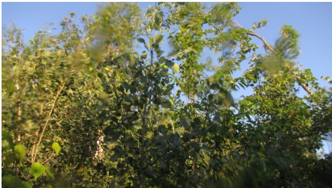
Photo 2 Station S01, Peuplements feuillus ou mixtes (sud, 21 juin).