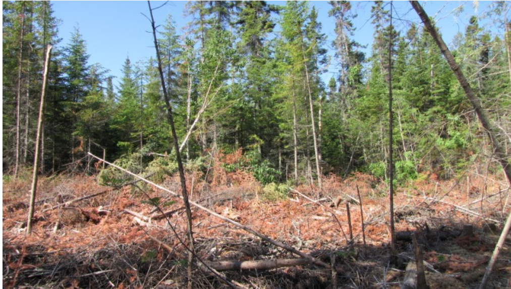
Photo 17 Station S08, Peuplements résineux, chemin de débardage (21 juin).