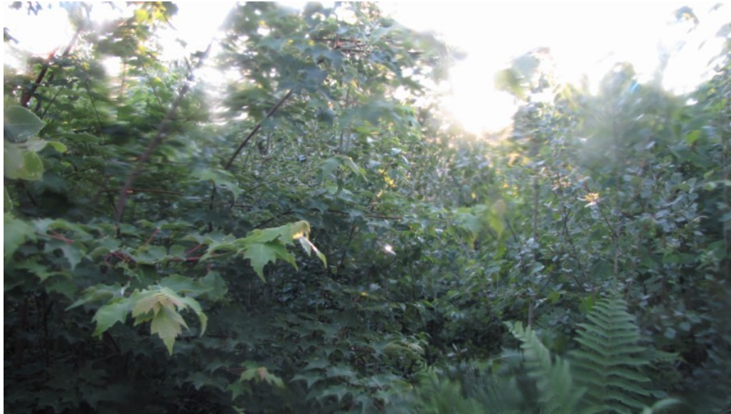
Photo 1 Station S01, Peuplements feuillus ou mixtes (nord, 21 juin).