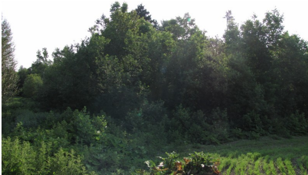
Photo 28 Station S14, Peuplements feuillus ou mixtes (nord, 22 juin).