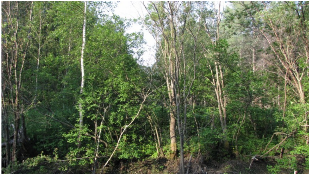
Photo 27 Station S12, Peuplements feuillus ou mixtes (sud, 22 juin).