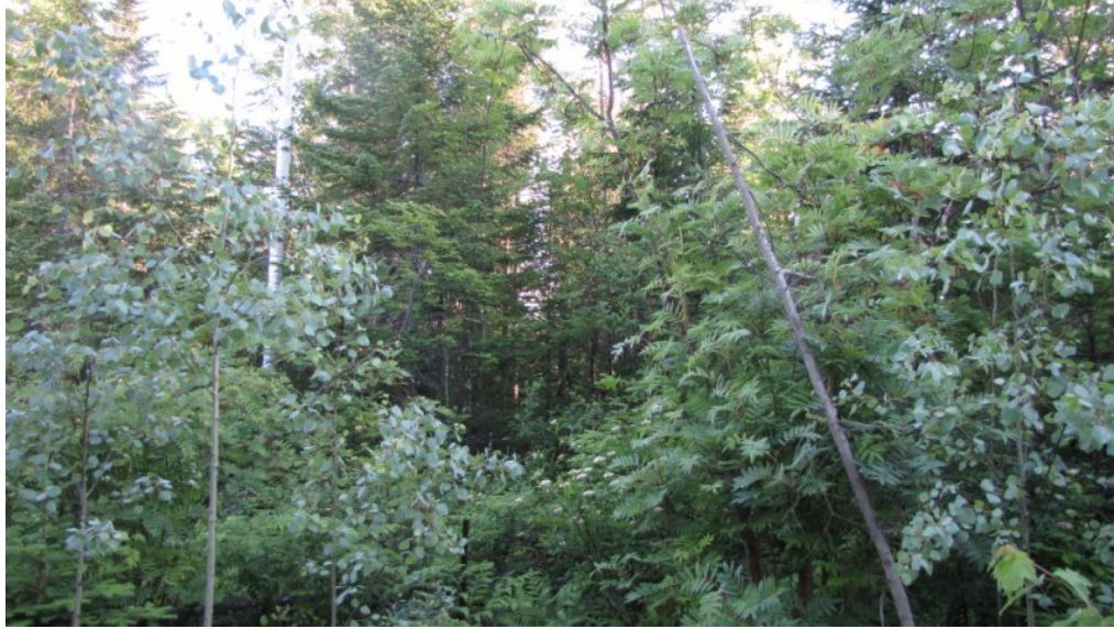
Photo 5 Station S03, Peuplements feuillus ou mixtes (nord, 21 juin).