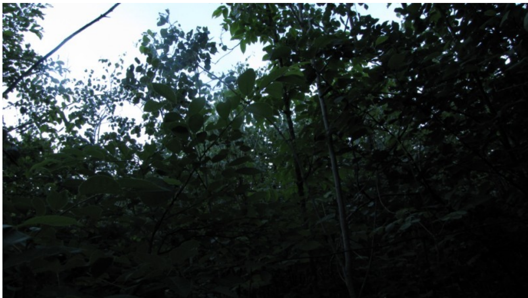
Photo 4 Station S02, Peuplements feuillus ou mixtes (sud, 21 juin).