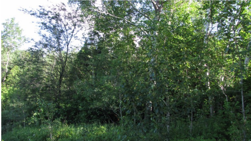
Photo 9 Station S05, Peuplements feuillus ou mixtes (nord, 21 juin).