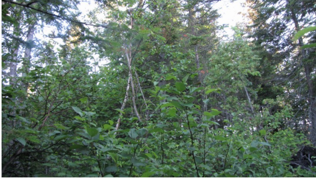
Photo 3 Station S02, Peuplements feuillus ou mixtes (nord, 21 juin).