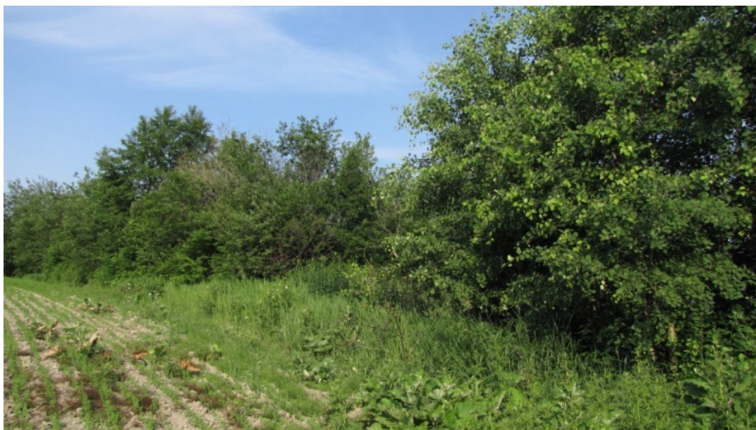
Photo 29 Station S14, Peuplements feuillus ou mixtes (sud, 22 juin).