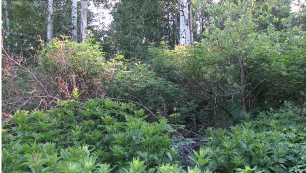
Photo 26 Station S13, Peuplements feuillus ou mixtes (nord, 22 juin).