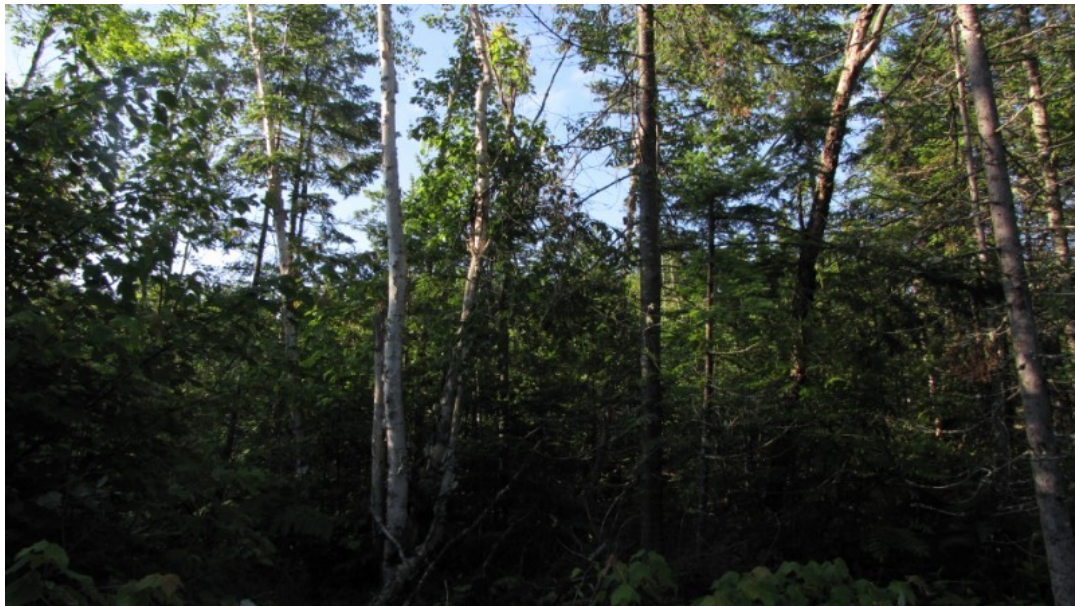
Photo 6 Station S03, Peuplements feuillus ou mixtes (sud, 21 juin).