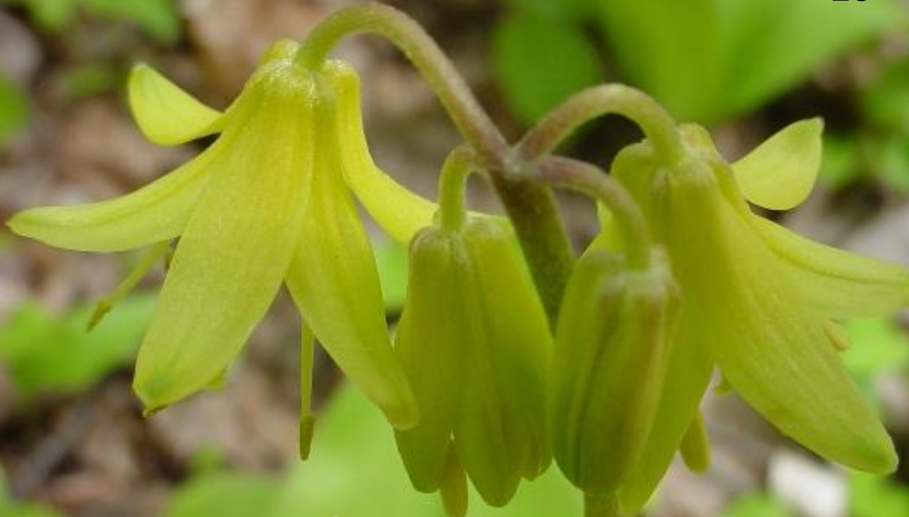
CLINTONIE BORÉALE Clintonia borealis