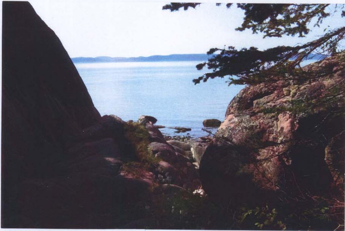
Figure 5: De la grotte, vue sur le fleuve