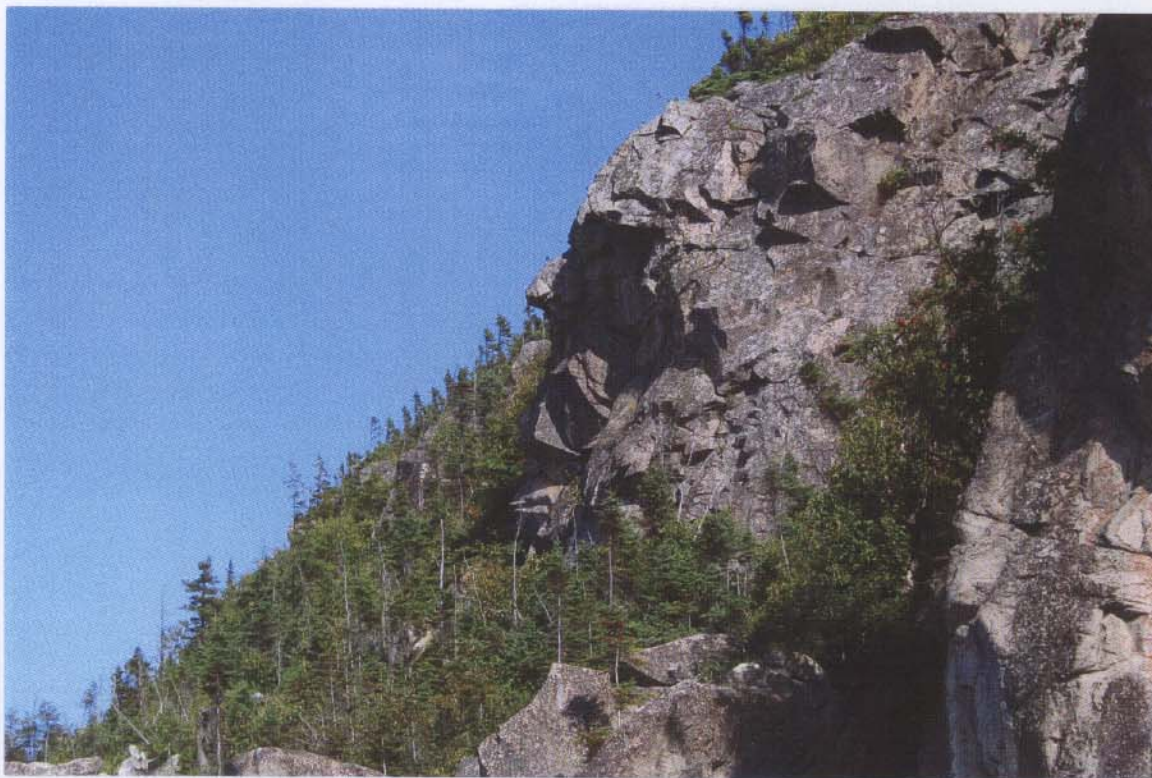
Figures 4: Avancée rocheuse près de l'entrée EST de la grotte (30-40m) Note: Similitude d'un visage. Défenseur des lieux depuis des millénaires. Photos: 02/09/06 Gerard Michaud