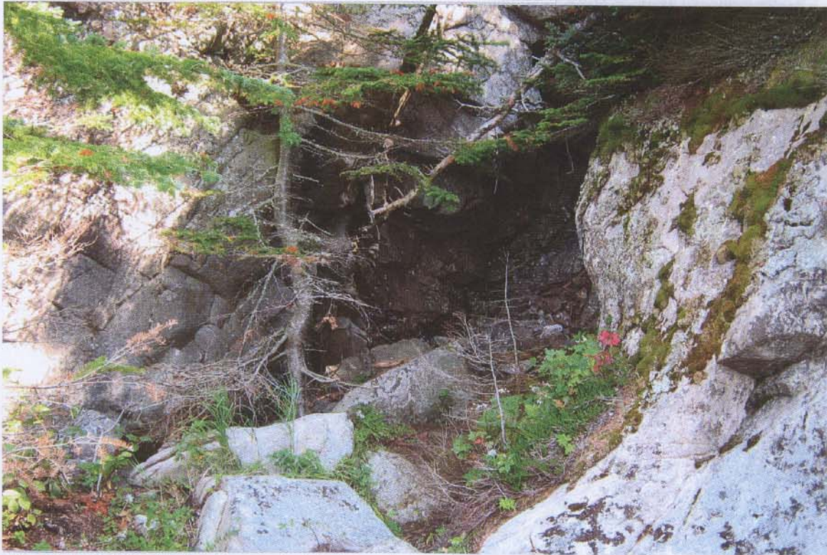
Figure 1: Entrée dissimulée au pied de la grotte Photos: 02/09/06 Gerard Michaud