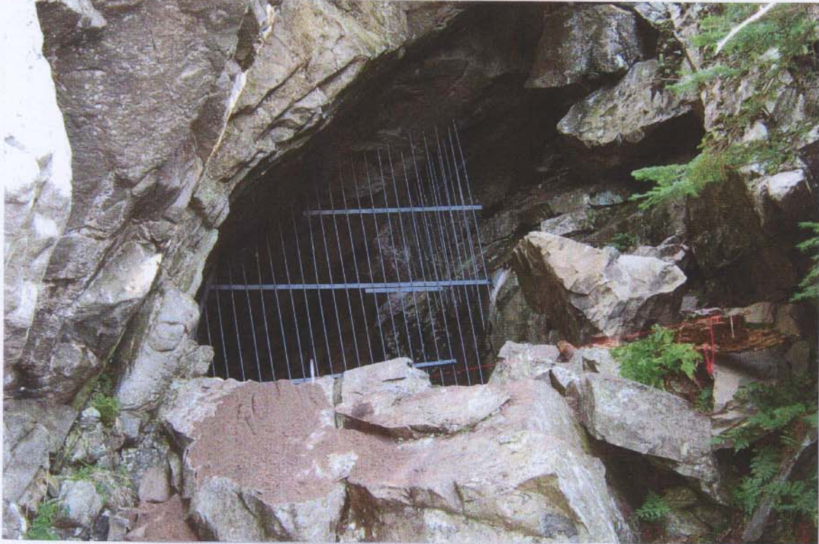
Figure 2: Aperçu de la grotte, grillage sécuritaire