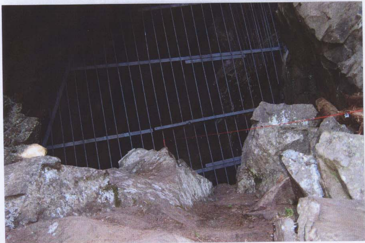
Figures 3: Grillage de protection des lieux Photos: 02/09/06 Gerard Michaud