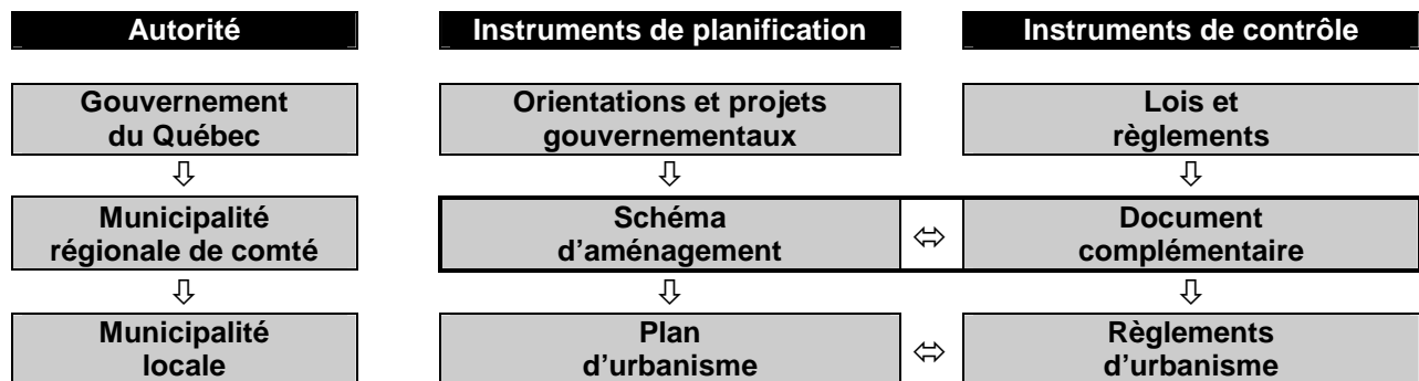
Les principaux instruments de planification et de contrôle