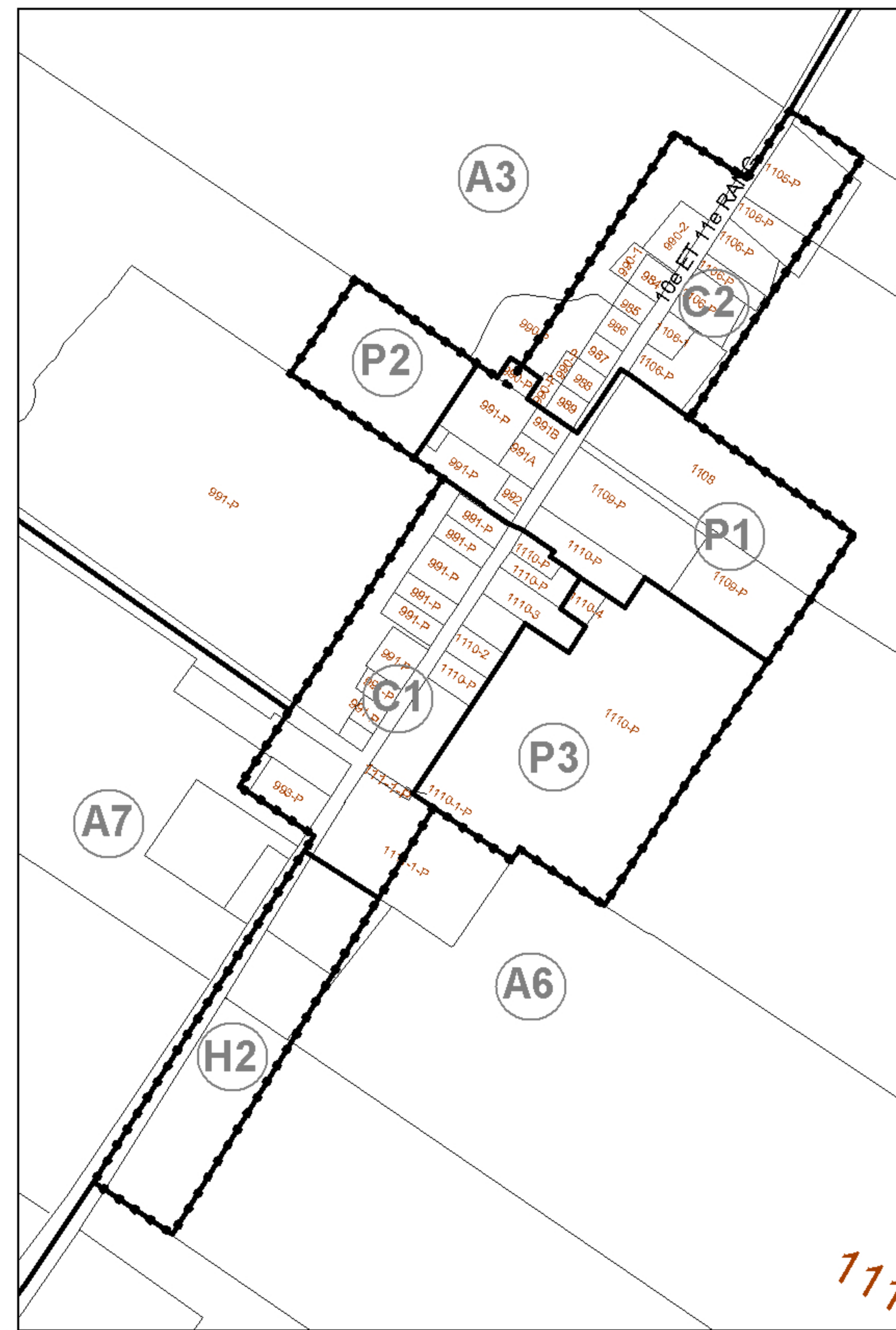
Agrandissement noyau villageois Échelle 1: 3 000

T. (819) 478-4616 F. (819) 478-2555 JM@urbanisme.net