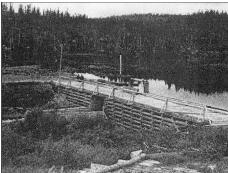
Barrage érigé en 1951 à l'embouchure de la rivière Franquelin Ouest