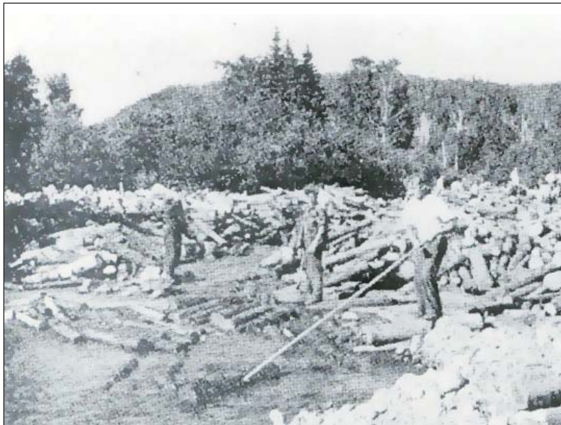
La drave sur la rivière Franquelin