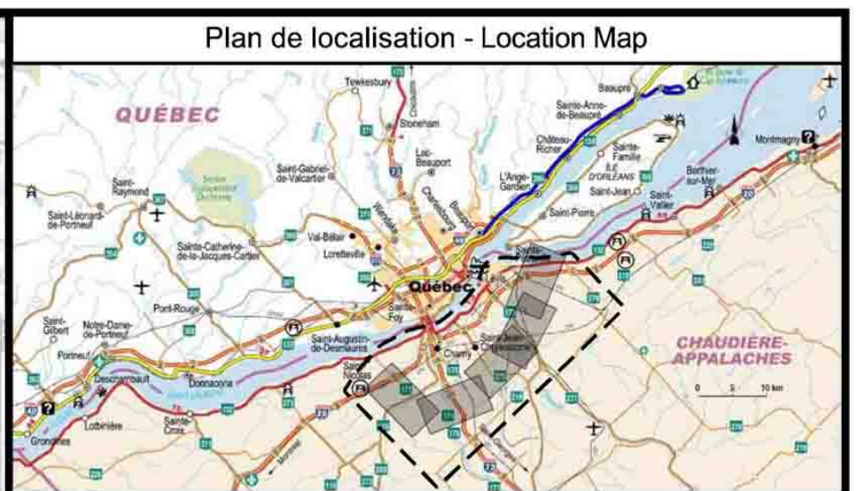
Tome 4 - Volume 2 - Annexe C - Figure I