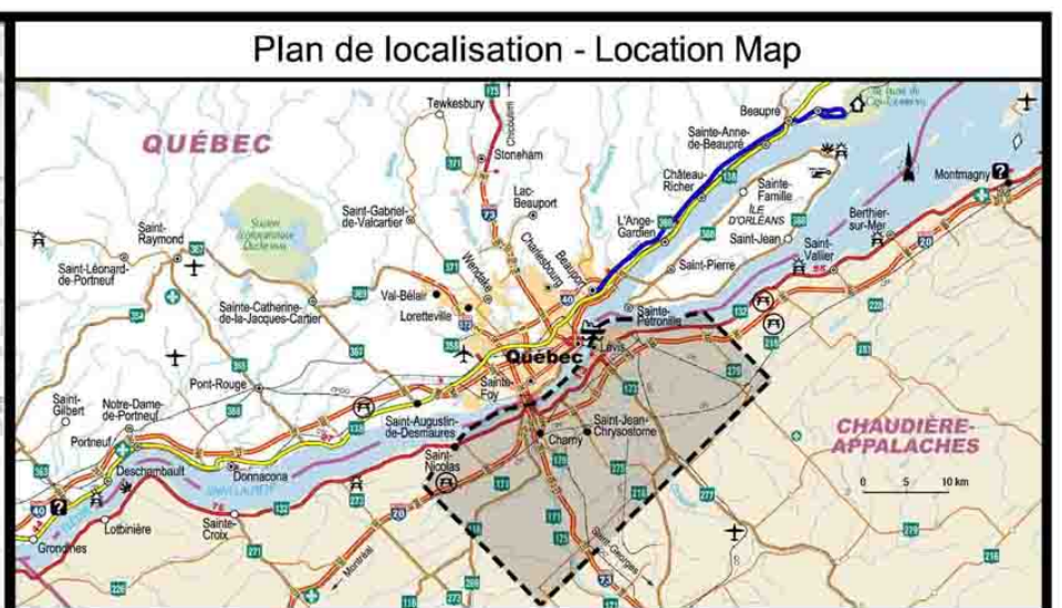
Tome 4 - Volume 2 - Annexe A - Figure 6