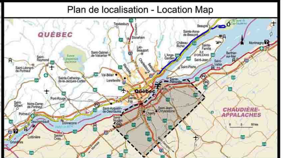
Tome 4 - Volume 2 - Annexe A - Figure 4