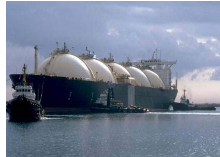
Méthanier de type MOSS / MOSS Type LNG Ship