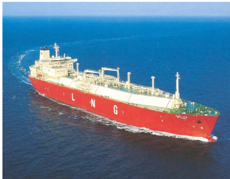
Méthanier de type membrane / Membrane Type LNG Ship