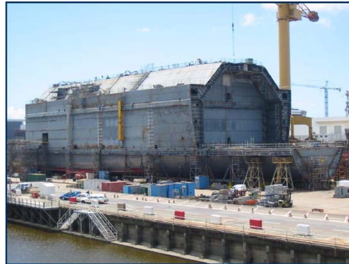
Extérieur de la cuve et double-coque / Tank Exterior and Double-Hull