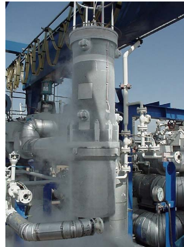
Retrait d'une pompe immergée d'un réservoir / Removal of a Submerged Pump from a Tank