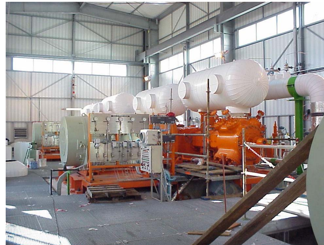
Compresseurs de gaz d'évaporation (Montoir de Bretagne / France) / Boil Off Gas Compressors (Montoir de Bretagne / France)

Titre / Title Pompes GNL et compresseurs de gaz d'évaporation / LNG Pumps and Boil Off Gas Compressors