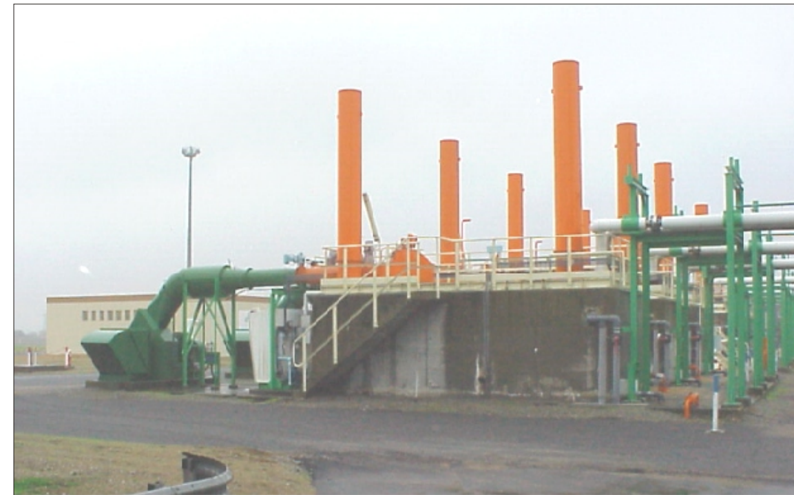
Photo d'un vaporiseur à combustion submergée du terminal méthanier de Montoir-de-Bretagne / Photo of the Submerged Combustion Vaporizer from the Montoir-de-Bretagne LNG Terminal