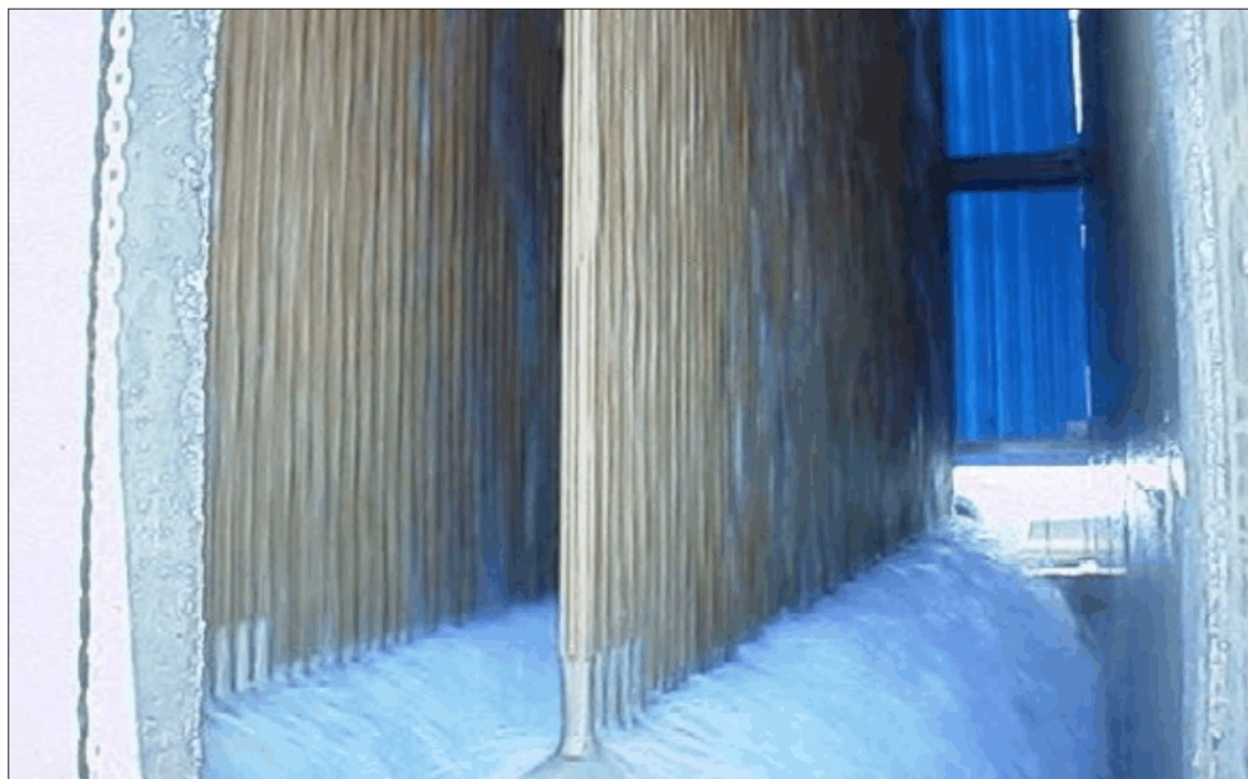
Photo d'un vaporiseur à ruissellement à eau du terminal méthanier de Montoir-de-Bretagne / Photo of open rack vaporizer from the Montoir-de-Bretagne LNG terminal