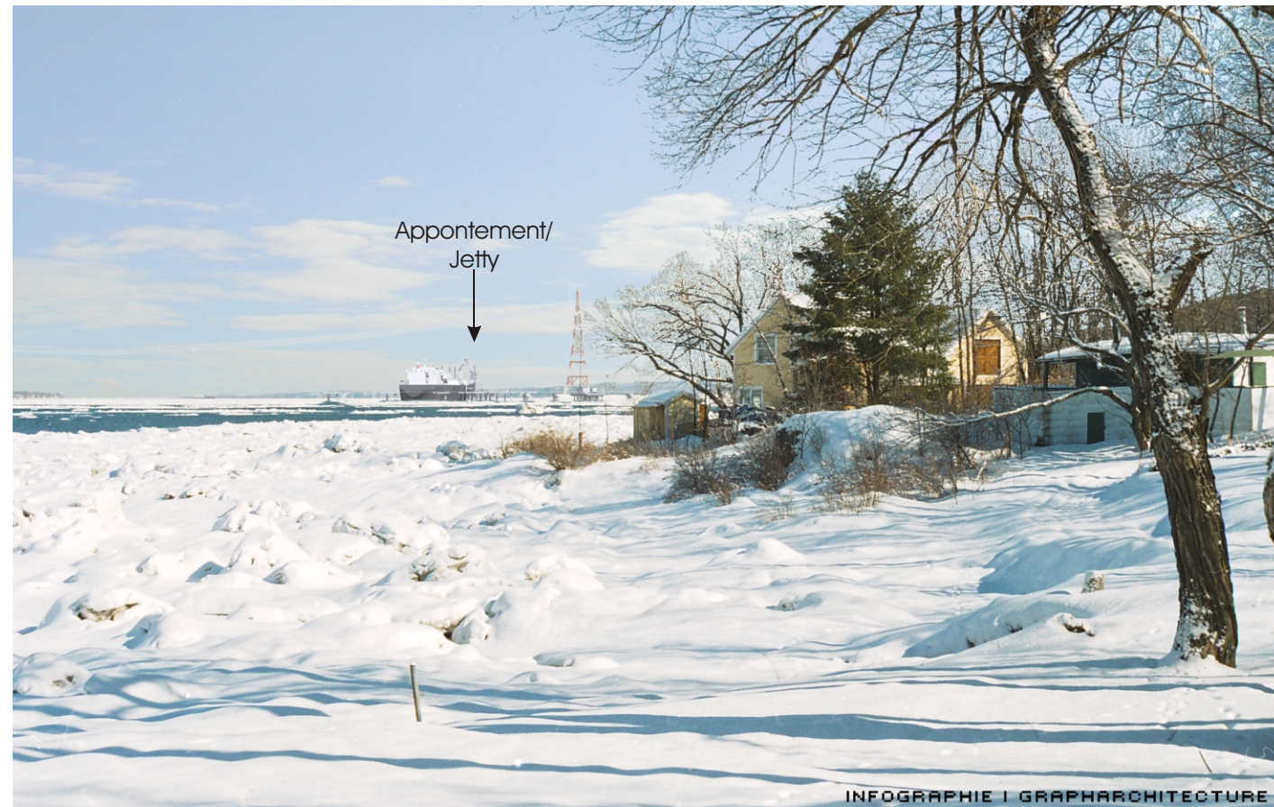
Point de vue #9 à partir de la Pointe de la Martinière / View #9 at Pointe de la Martinière