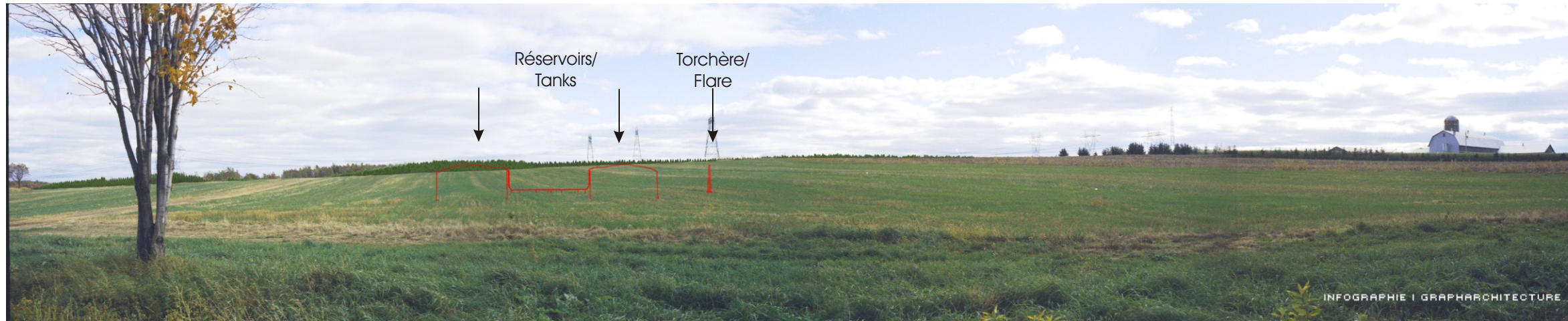
Point de vue #5 à partir de la route 132, Lévis - Après 10 ans en été / View #5 on road 132, Lévis - After 10 years in summer