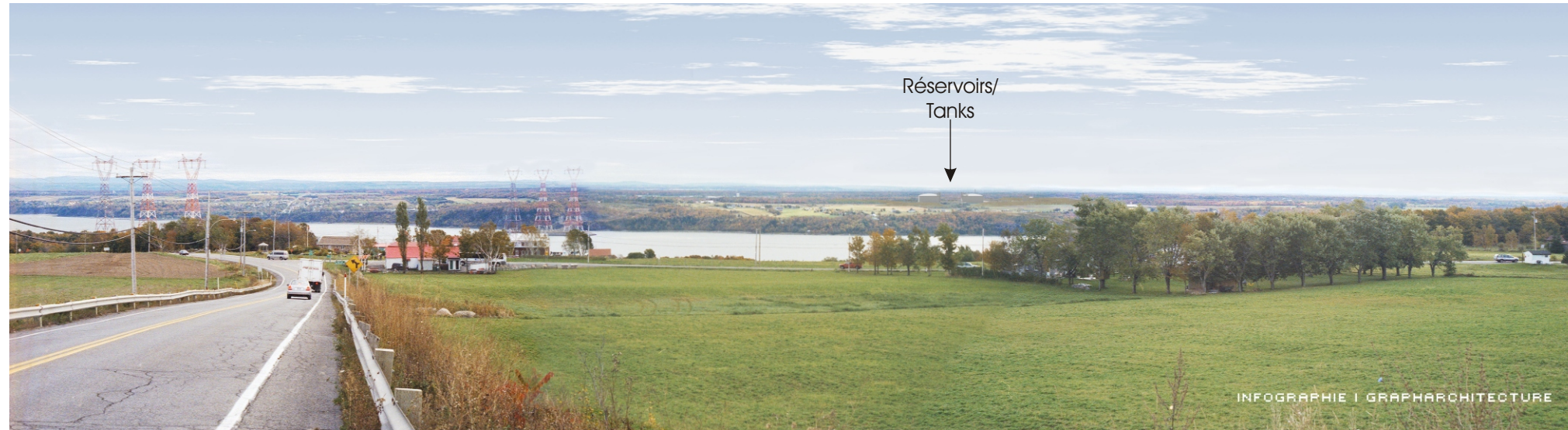
Point de vue #3 à partir de la route Prévost, Île d'Orléans - Sans arbres / View #3 at Prévost Road, D'Orléans Island - Without trees