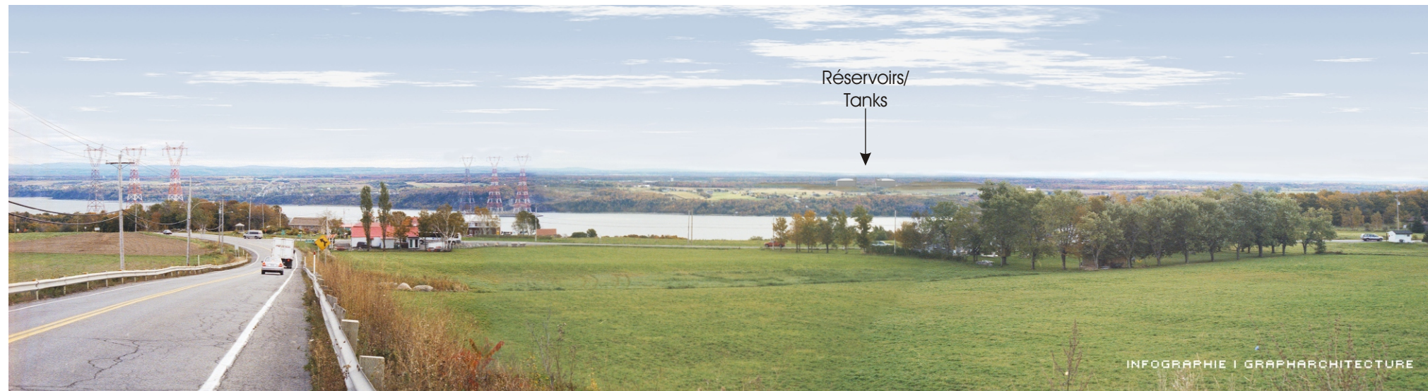
Point de vue #3 à partir de la route Prévost, Île d'Orléans - Après 1 an / View #3 at Prévost Road, D'Orléans Island - After 1 year