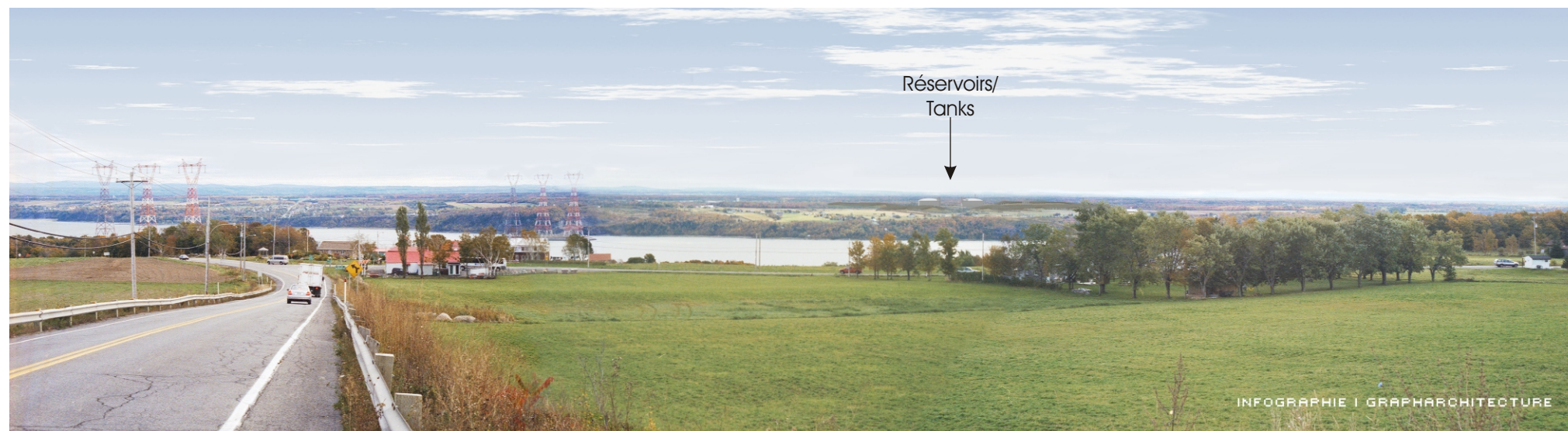
Point de vue #3 à partir de la route Prévost, Île d'Orléans - Après 10 ans / View #3 at Prévost Road, D'Orléans Island - After 10 years