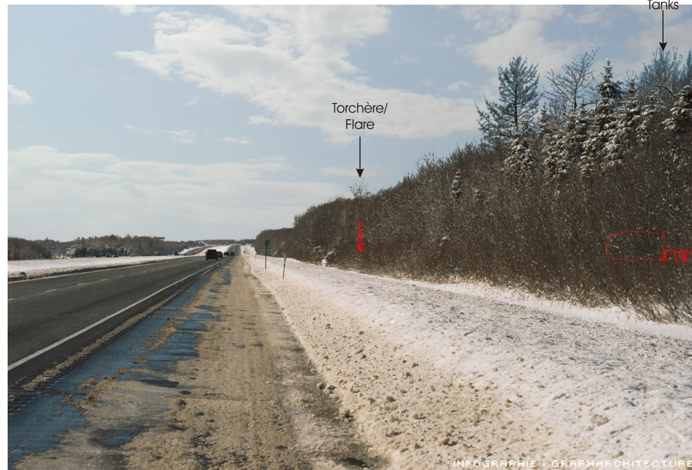
Point de vue #10 à partir de l'autoroute 20 direction ouest à Beaumont / View #10 on Highway 20, in Beaumont, looking West