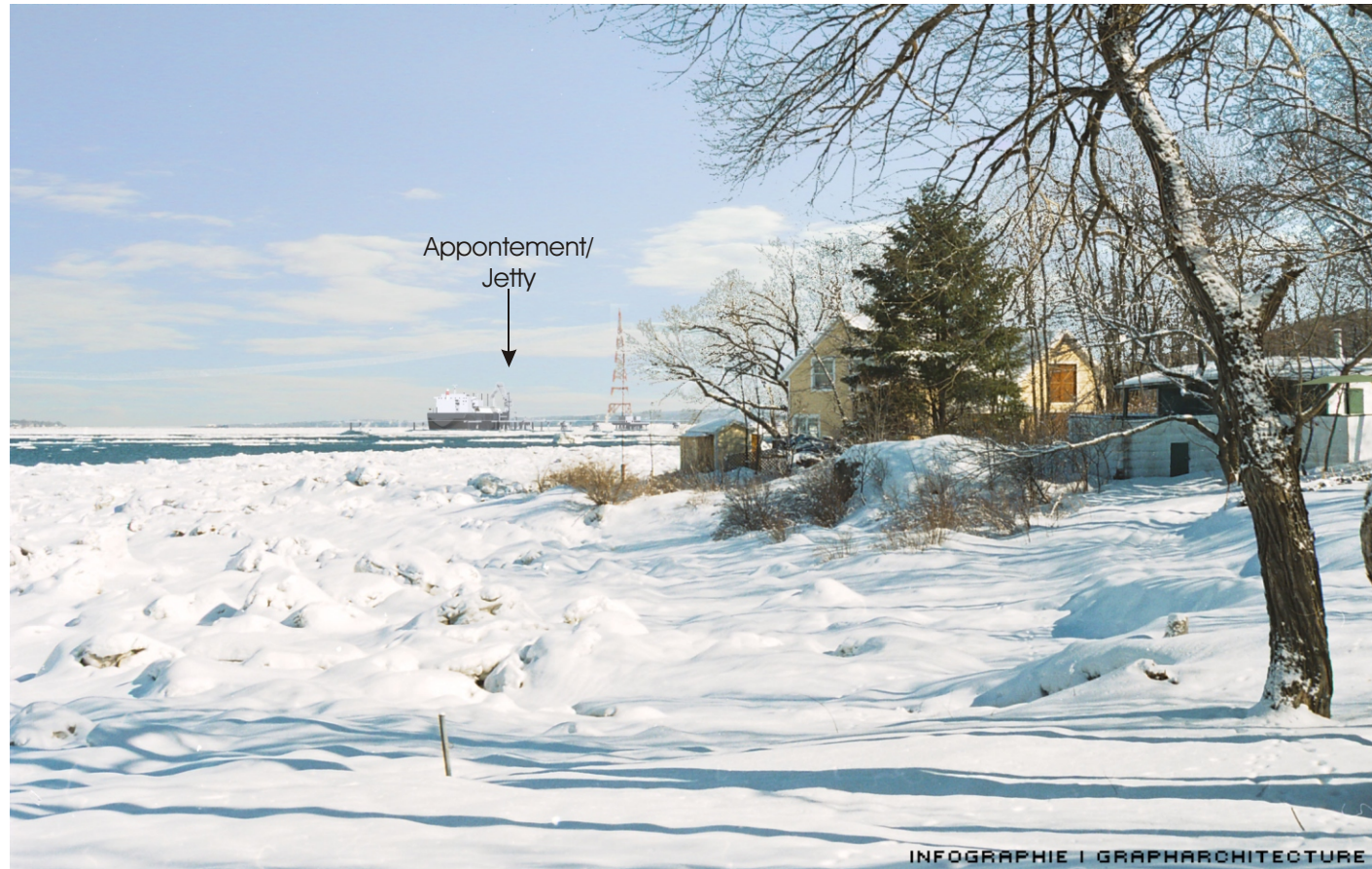
Point de vue #9 à partir de la Pointe de la Martinière / View #9 at Pointe de la Martinière