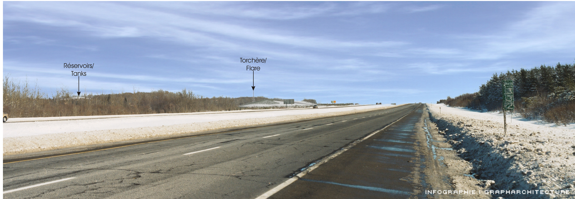
Point de vue #8 à partir de l'autoroute 20, direction est à Lévis - Après 1 an / View #8 on highway 20, Lévis, looking East - After 1 year