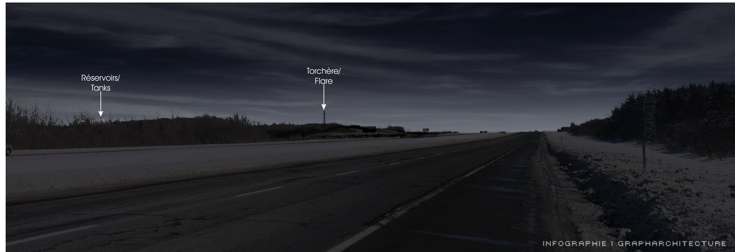
Point de vue #8 à partir de l'autoroute 20, direction est à Lévis - De nuit / View #8 on highway 20, Lévis, looking East - At night