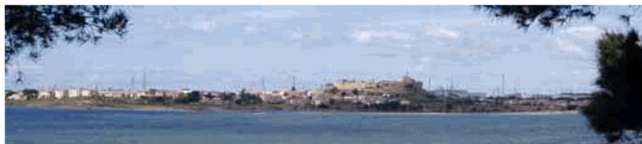
/ Les villes alentours : FOS-SUR-MER