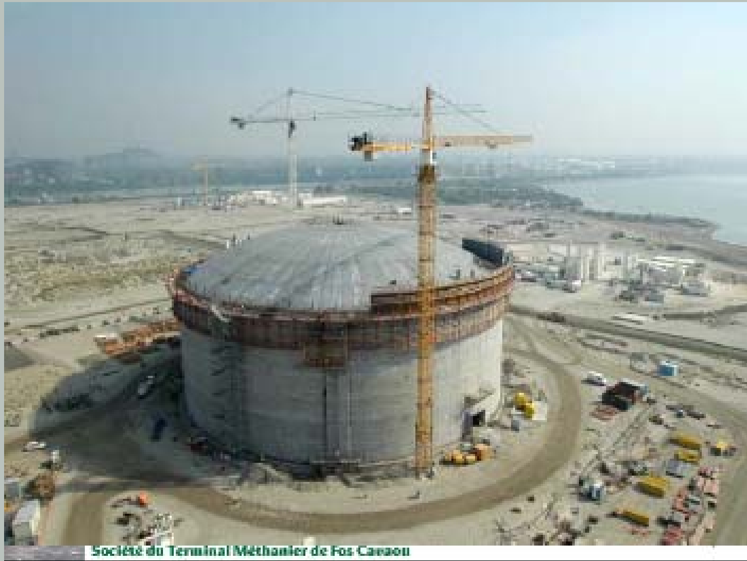
Société du Terminal Méthanier de Fos Cavaou