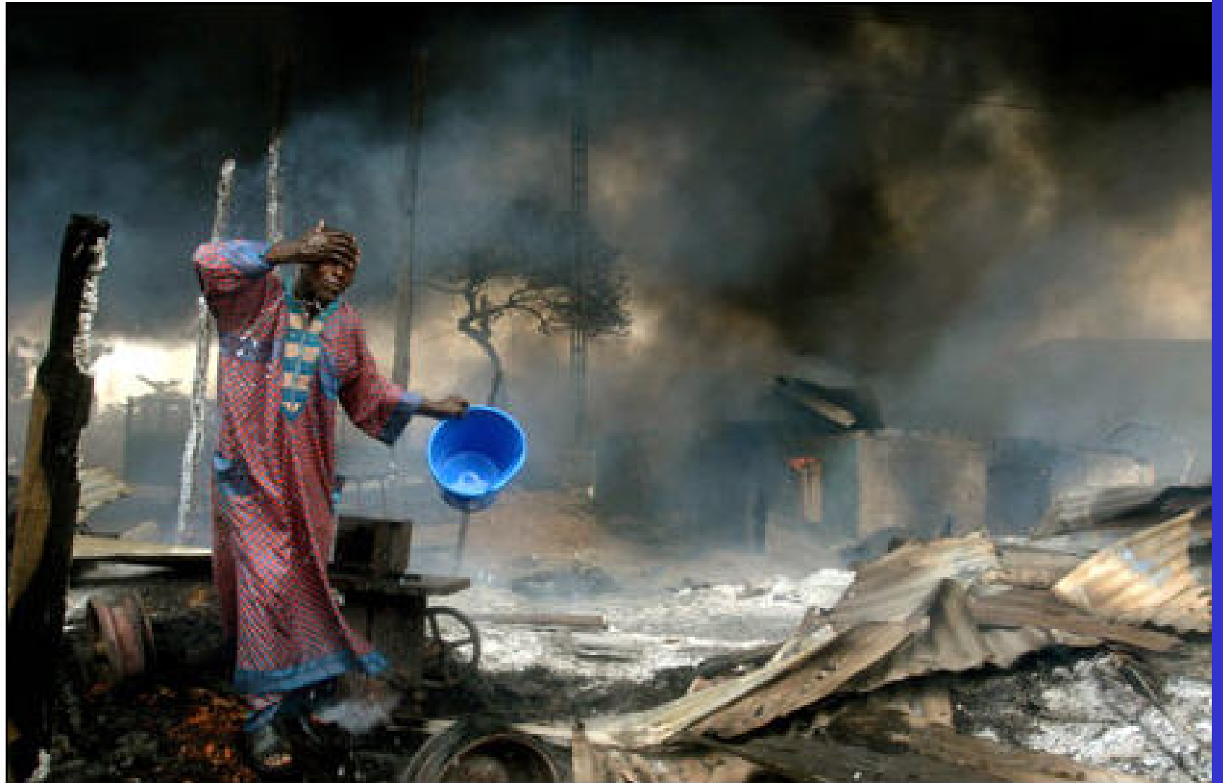
Photo in the News: Nigeria Pipeline Explosion Incinerates Hundreds