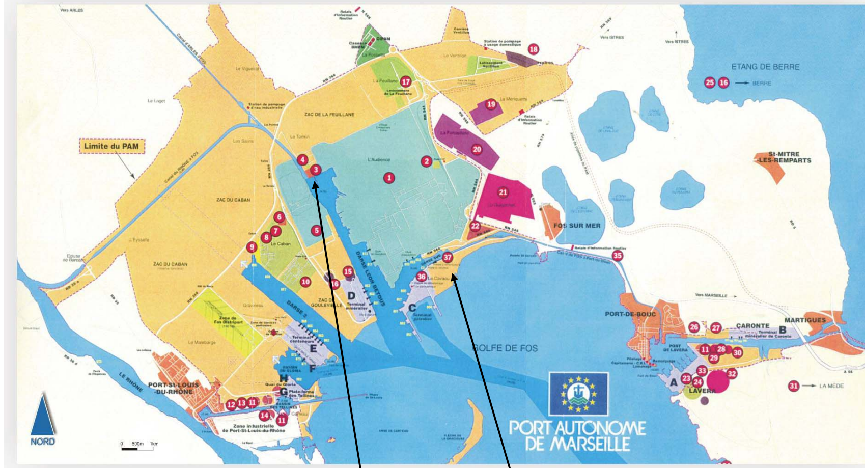
Terminal de Fos-Tonkin