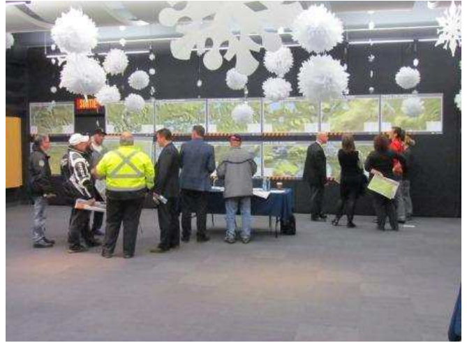
Pessamit – 26 novembre 2013