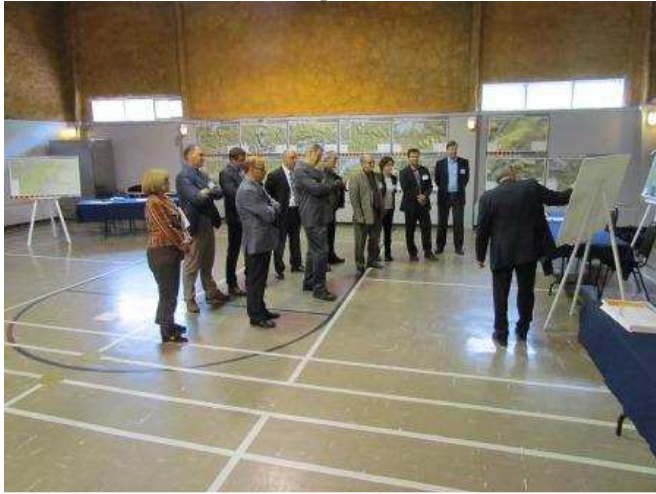
Baie-Comeau – 8 et 9 septembre 2013