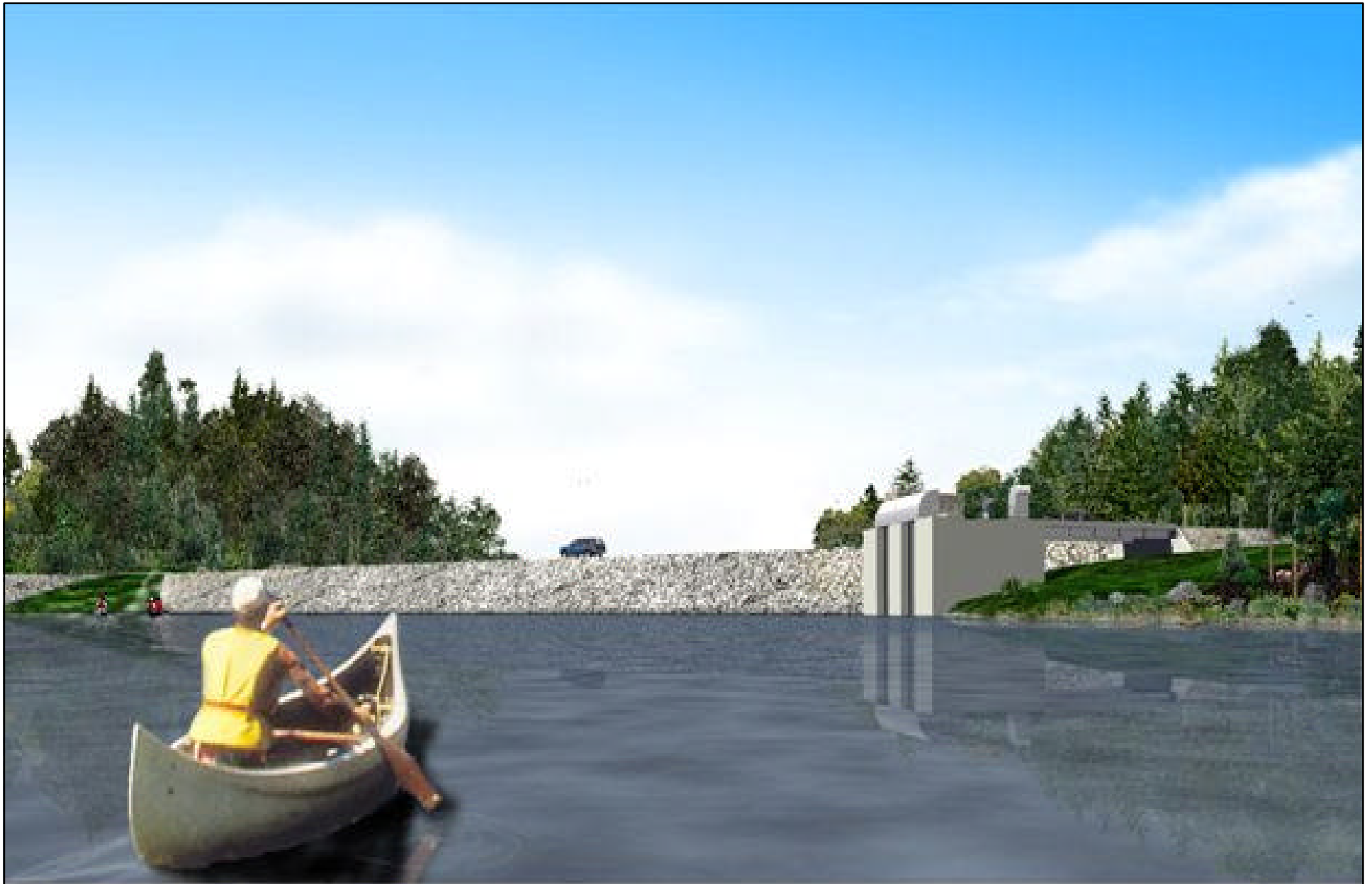
Simulation visuelle Réservoir Pikauba