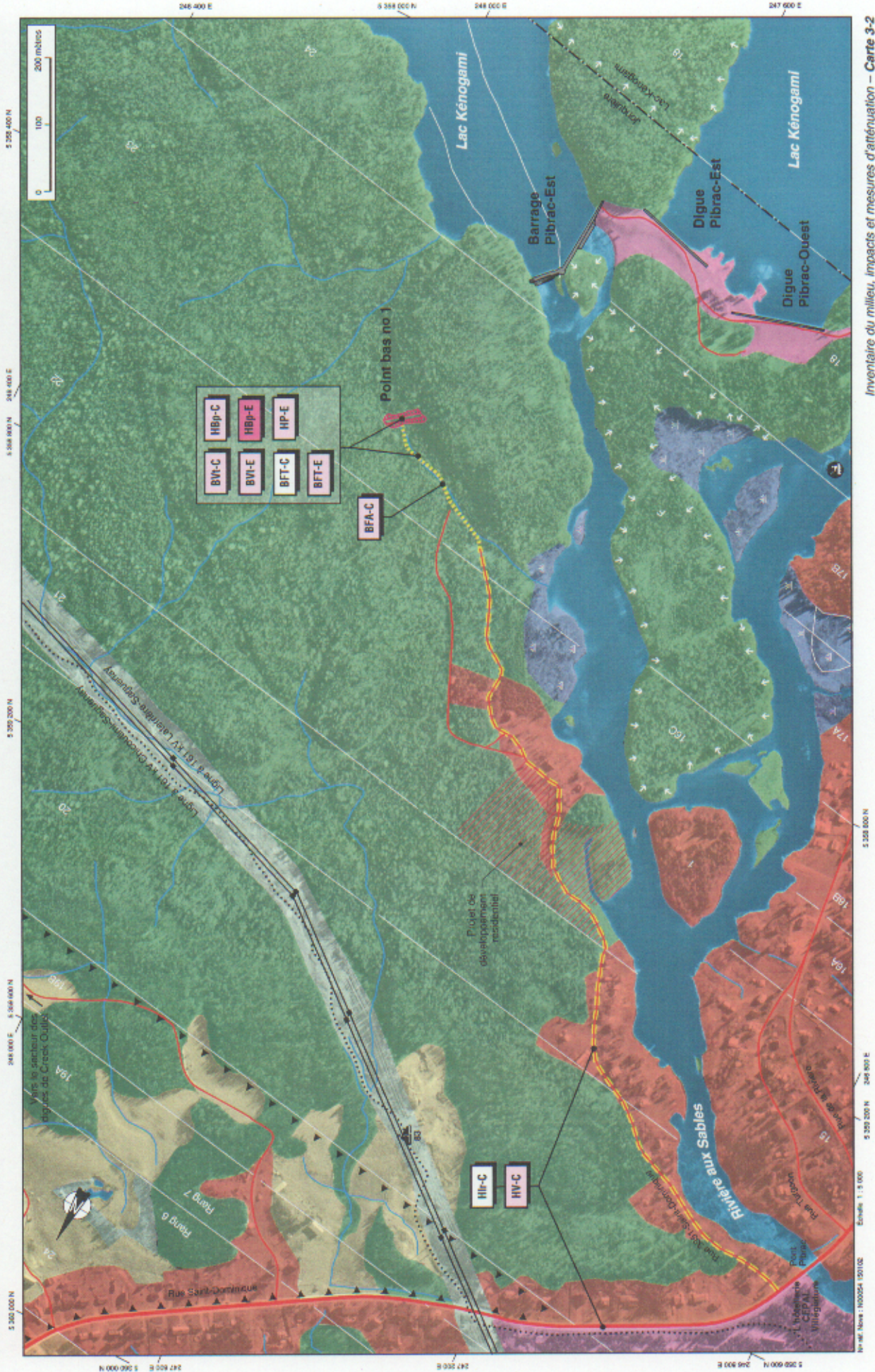
Inventaire du milieu, impacts et mesures d'atténuation – Carte 3-2 Secteur du point bas no 1 – Feuillet 13