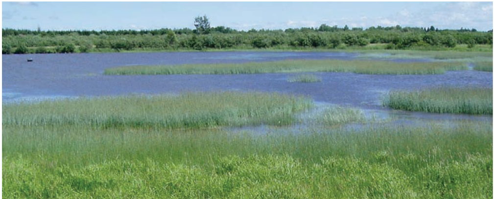
Les milieux humides Tikouamis

Ainsi, être acteur du développement durable, c'est tenir compte des conséquences prévisibles de ses actes dans ses décisions sur les plans environnemental, social et économique : c'est penser globalement et agir localement.