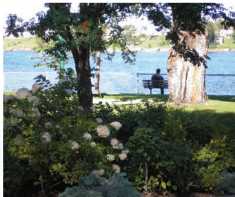
Le Parc Sacré-Coeur

En somme, le comité en charge du lancement de la démarche d'Agenda 21 local n'est pas le seul auteur et acteur de ce plan d'action; les citoyens, les élus, ainsi que les divers services de la municipalité sont étroitement impliqués dans l'élaboration et la réalisation de ce plan d'action.