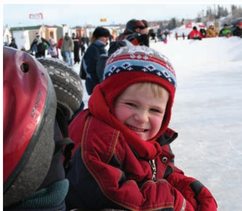
Activités pour toute la famille au Village Boréal

Le partage du territoire, tout comme celui du travail, demande une prise de conscience des conséquences des choix collectifs, corporatifs et individuels. Par exemple, l'étalement urbain, suscité par une recherche de tranquillité et d'esthétique du paysage, entraîne la dispersion de l'habitat sur le territoire, des coûts collectifs pour les services municipaux et potentiellement des conflits avec les usages agricoles ou industriels. Par ailleurs, l'établissement des récentes priorités et du choix de la nouvelle route de contournement en dehors du centre-ville ainsi que le plan de revitalisation du centre-ville ont favorisé une concertation entre les acteurs, une des étapes en vue de la construction collective d'un projet de territoire.