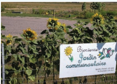
Le Jardin communautaire