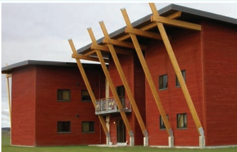
La résidence étudiante du Cégep faite de matériaux verts