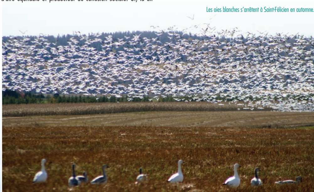
Les oies blanches s'arrêtent à Saint-Félicien en automne.

Malgré la prédominance des propriétaires par rapport aux locataires, malgré une offre de logement acceptable, la question de l'accès à des logements appropriés en fonction des clientèles et l'accès au logement social demeurent problématiques. Les efforts de la Ville pour mettre en branle la revitalisation de son centre-ville, selon une approche participative, ont donné des fruits.