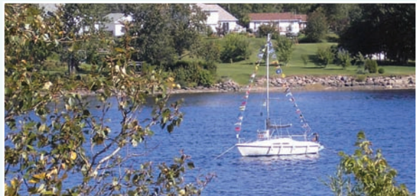
Vent d'est, vent d'ouest, vent neuf...