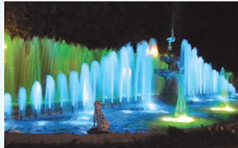
La fontaine du Parc Sacré-Coeur