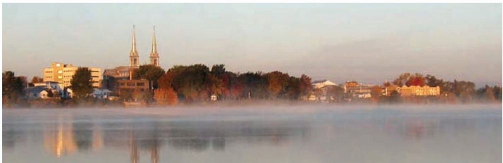
La rivière Ashuapmushuan

Enfin, le plan d'action préliminaire a été remis aux élus et aux différents services municipaux qui se le sont approprié et qui en ont permis la réalisation. La mise en oeuvre du plan d'action sera assurée par un comité de suivi.