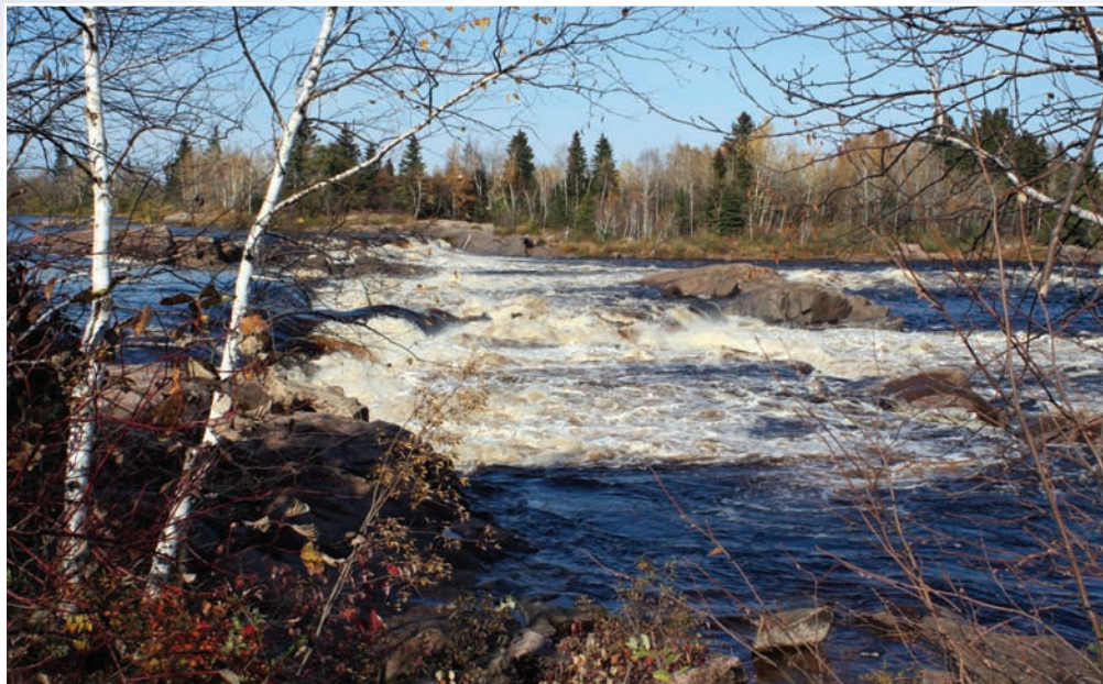
Les Chutes à Michel