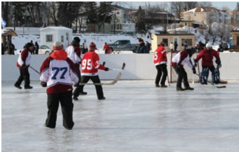
Hockey bottines au Village Boréal