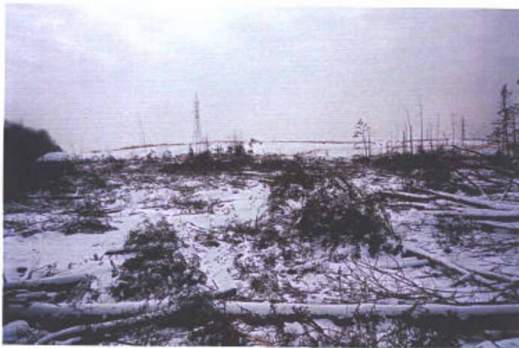
PLUSIEURS BONS ARBRES ✓ #5