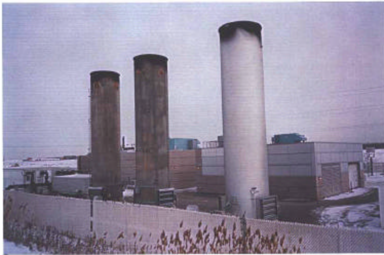
ET SES FAMEUSES TORCHÈRES !