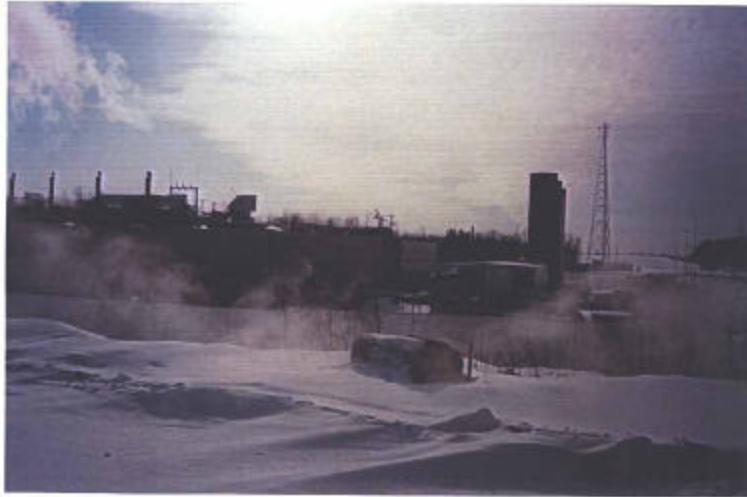
LA CENTRALE ...