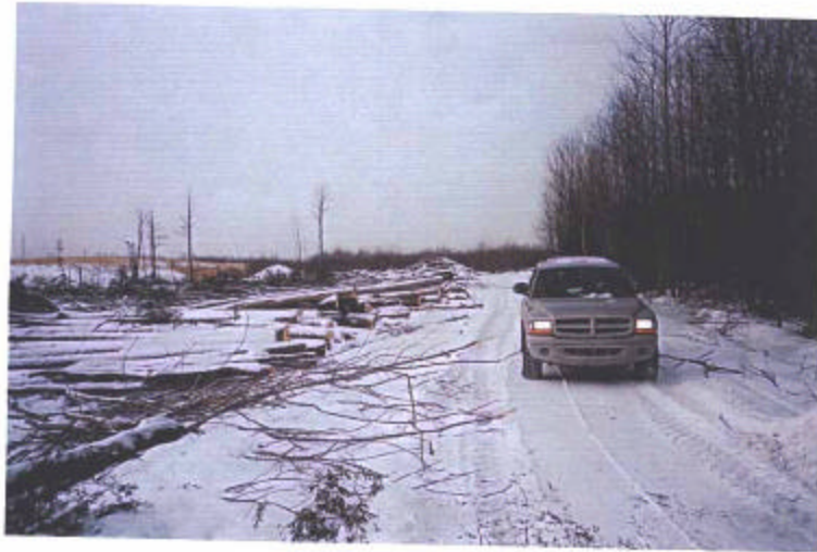
UN DÉBOISEMENT NON-AUTORISÉ #4